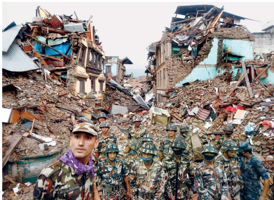
VARIOS SOLDADOS NEPALÍES PARTICIPAN EN UNA OPERACIÓN DE RESCATE EN UN EDIFICIO DERRUMBADO POR EL SEÍSMO QUE HA GOLPEADO EL PAÍS ASIÁTICO, EN SHAKU, NEPAL.

Nepal lucha contrarreloj con sus escasos medios para encontrar supervivientes del terremoto y afrontar un desastre que supera los 5.000 muertos y 8 millones de damnificados, mientras la ayuda internacional se empieza a distribuir e intenta llegar a las zonas de montaña que quedaron aisladas.