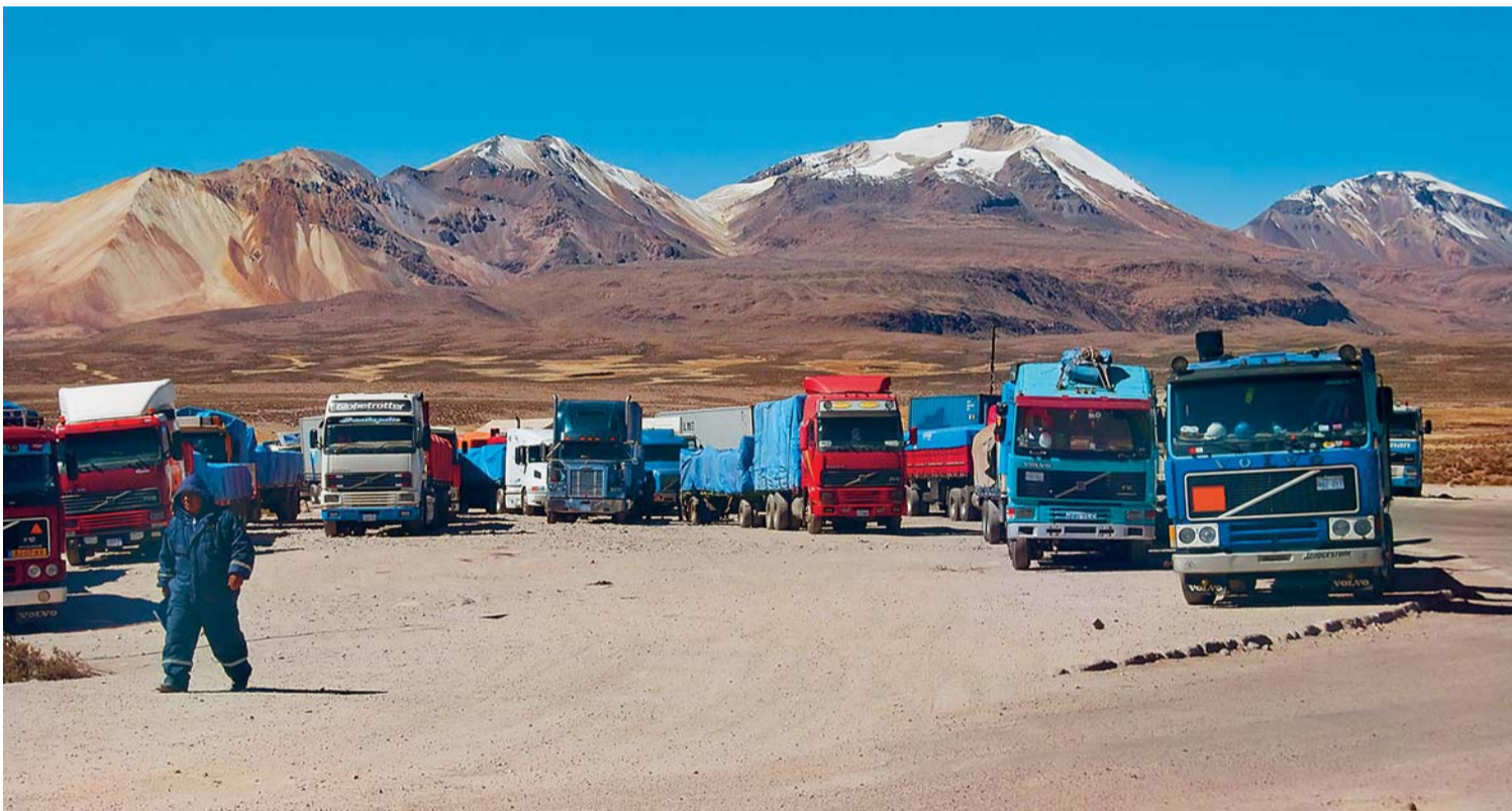
LAS CÁMARAS REGIONALES DE TRANSPORTE SE REÚNEN HOY PARA DEFINIR EL DÍA EN QUE SE INICIARÁ EL BLOQUEO EN FRONTERAS Y RECINTOS ADUANEROS. EL SECTOR SE OPONE AL DECRETO SUPREMO 2295.

Inf. Pag. 6, 1er. cuerpo Inf. Pag. 2, 3er. cuerpo