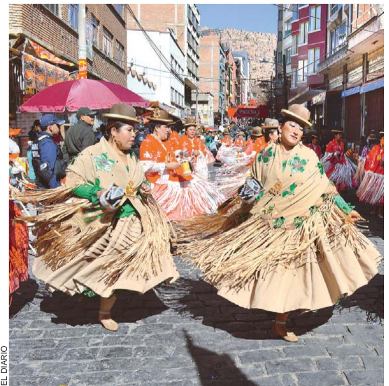
LA PARTICIPACIÓN DE LAS MUJERES LE DA REALCE A LA MORENADA, UNA DE LAS PRINCIPALES DANZAS EN EL GRAN PODER.

Ayer al menos 35 mil devotos de las 65 fraternidades que participarán en la entrada del Señor del Gran Poder el próximo sábado realizaron la promesa de fe y devoción.