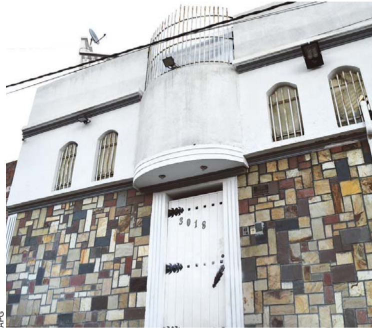
FRONTIS DEL DOMICILIO DONDE GUARDABA DETENCIÓN.

Asimismo, el fiscal general del Estado, Ramiro Guerrero, informó que se instruyó al