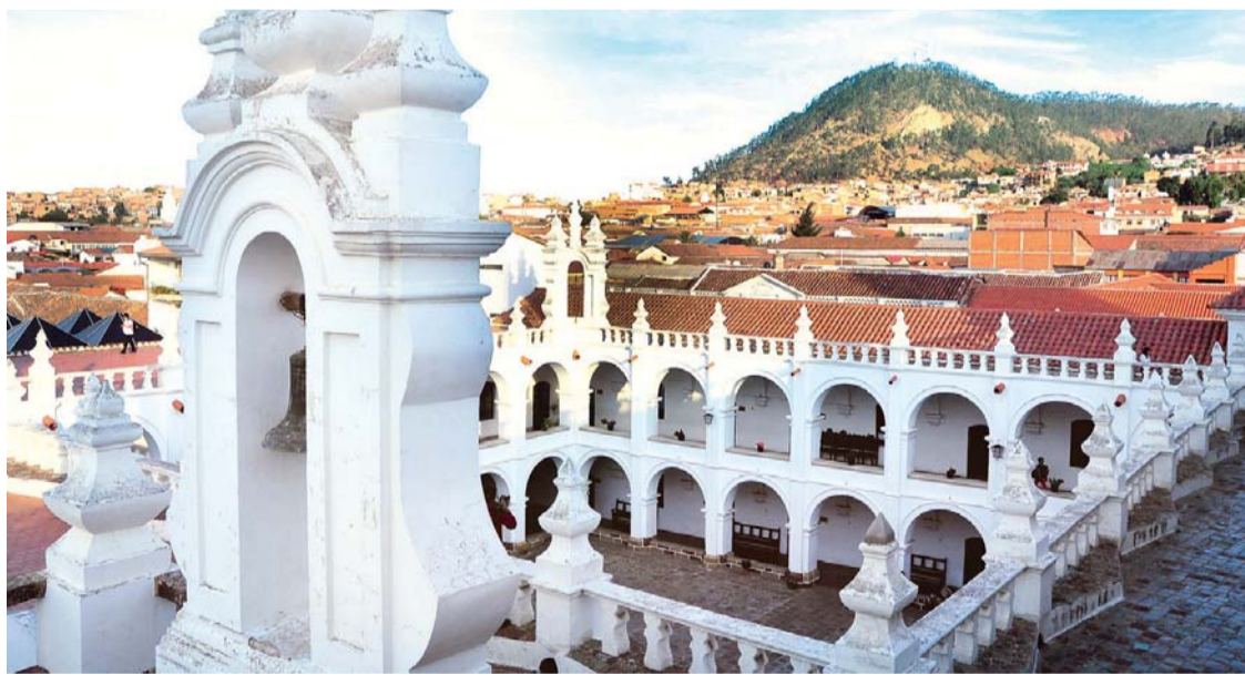
CIUDAD BLANCA, CAPITAL CONSTITUCIONAL DE BOLIVIA, SUCRE, QUE HOY ESTÁ DE ANIVERSARIO.

Autónomo Municipal de Sucre. Las máximas autoridades procedieron al encendido del Fuego de Mayo tras ascender a la torre principal de Basílica de San Francisco, donde además se encuentra la histórica Campana de la Libertad.