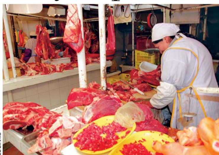
VENTA DE CARNE DE RES FUE REGULAR EN MERCADOS LOCALES, PERO CON PRECIOS INCREMENTADOS A CRITERIO DEL COMERCIALIZADOR.

Asimismo, el ministro de Economía, Luis Arce, informó que "la utilidad neta de los carniceros intermediarios del país asciende a 754.308 bolivianos cada mes", es decir, unos 108.377 dólares. En