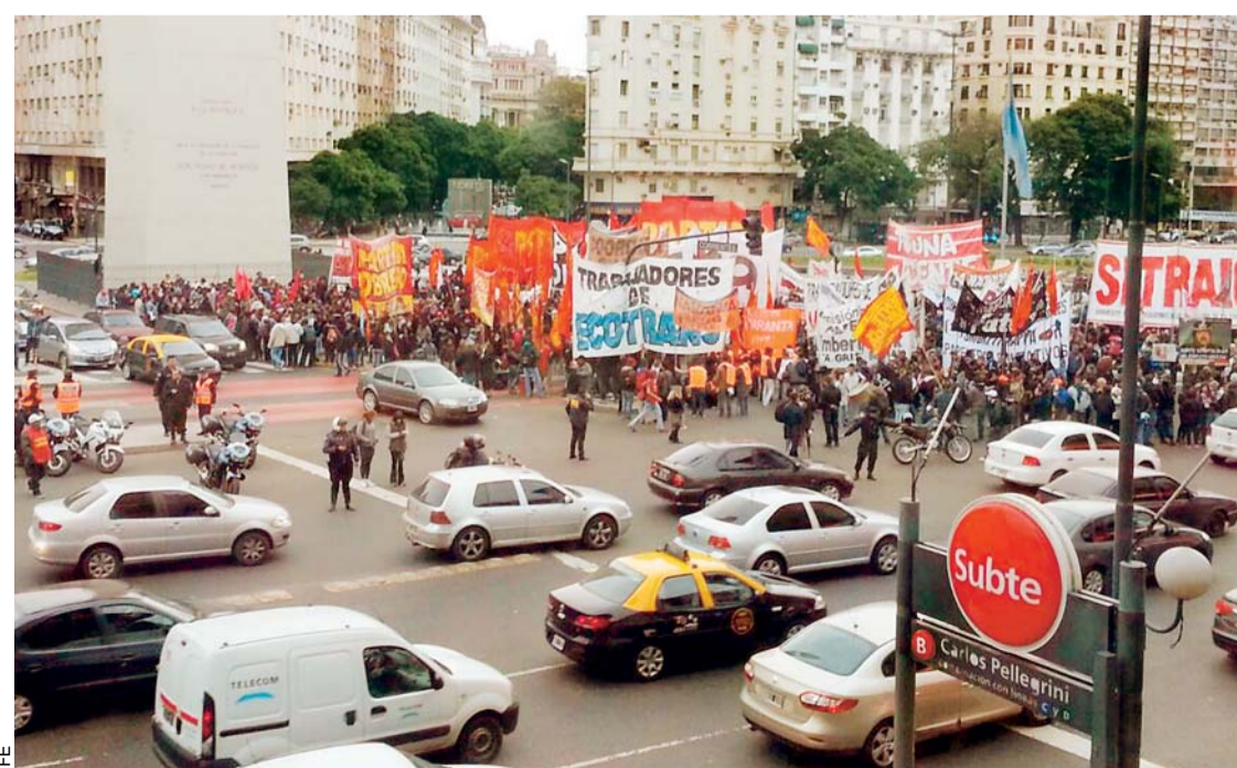
PROTESTA DE SINDICATOS EN PLENO CENTRO BONAERENSE. LA HUELGA GENERAL AFECTÓ AL TRANSPORTE EN CIUDADES, TRENES Y VUELOS QUE FUERON CANCELADOS.

El otro estreno de la semana es "El club de los incomprendidos", película basada en la exitosa novela juvenil "Buenos días, princesa", primera parte de la trilogía creada por el escritor español Francisco de Paula, popularmente conocido como Blue Jeans.