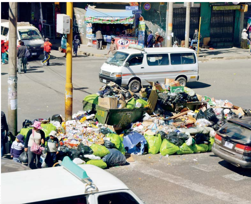
LAS ACTIVIDADES SE DESARROLLAN CON NORMALIDAD EN EL ALTO, PERO LA BASURA INUNDA LAS CALLES Y CREA FOCOS DE INFECCIÓN.