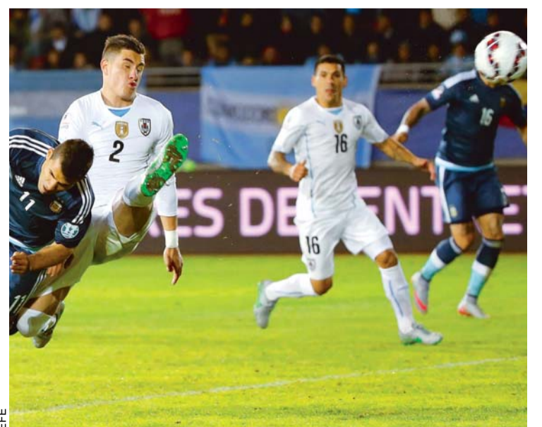
EL DELANTERO ARGENTINO SERGIO AGÜERO (1) REMATA DE CABEZA ANTE EL DEFENSA URUGUAYO JOSÉ GIMÉNEZ (21), PARA MARCAR EL PRIMER GOL DEL PARTIDO ARGENTINA-URUGUAY, DEL GRUPO "B" DE LA COPA AMÉRICA DE CHILE 2015, EN EL ESTADIO LA PORTADA DE LA SERENA, CHILE.