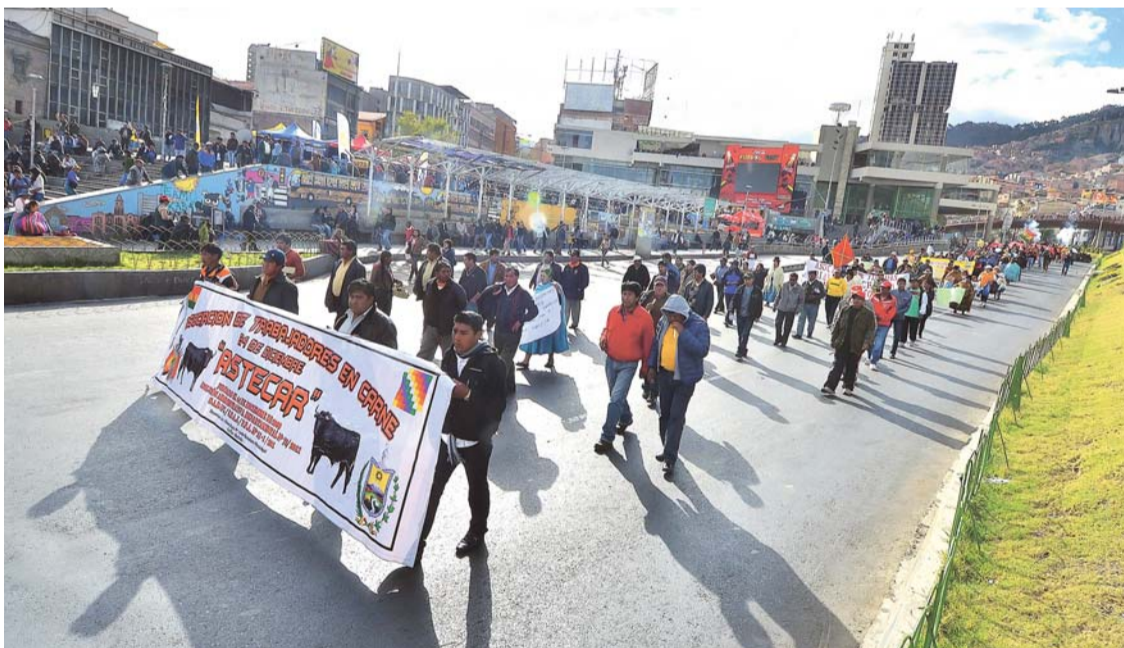
MOVILIZACIÓN DE COMERCIALIZADORES DE CARNE EN LA PAZ.

Después de una jornada movilizadora protagonizada ayer por el sector de comerciantes de productos cárnicos de todo el país, el principal dirigente de la