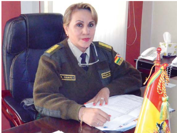
GENERALA ROSARIO CHÁVEZ.

• La oficial realizó denuncias por supuesta corrupción dentro de la Policía y aseguró que entregó una lista de implicados al Ministerio de Gobierno