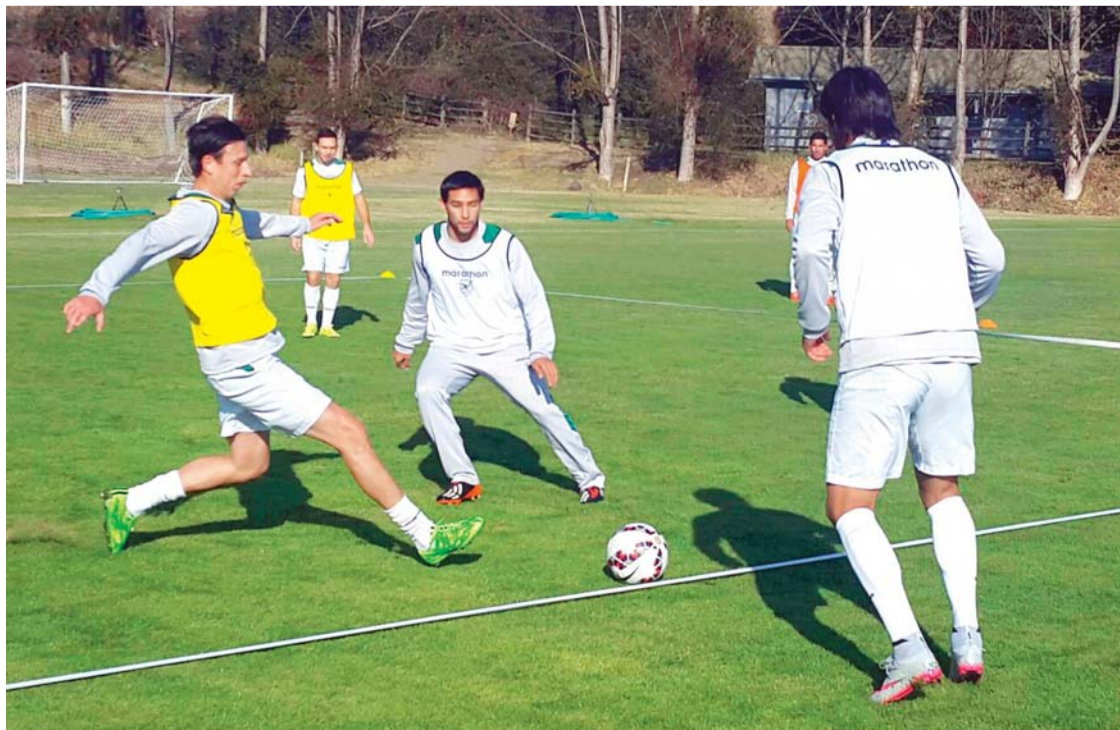
ENTRENAMIENTO DEL SELECCIONADO BOLIVIANO EN LOS APRESTOS PARA EL PARTIDO DE ESTA NOCHE FRENTE A CHILE, EN LA COPA AMÉRICA.