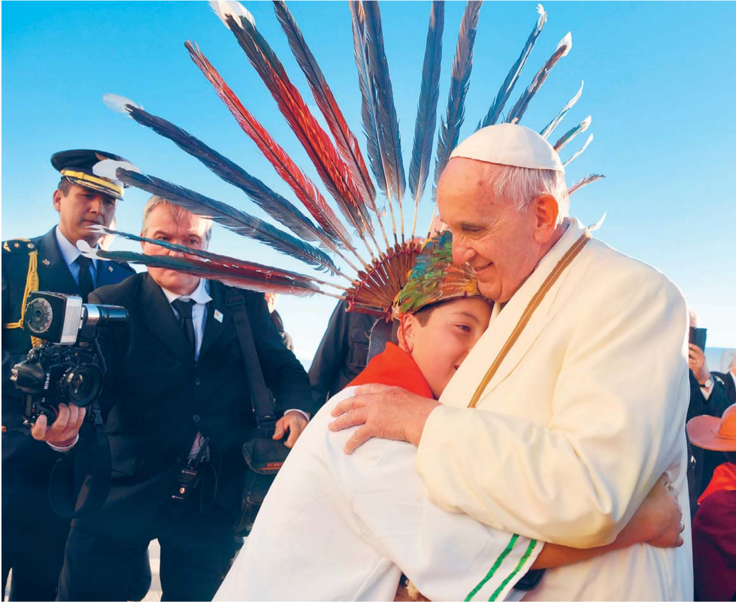
PRIMERA EMOCIÓN PROFUNDA Y SENTIDA. UN NIÑO CON VESTIMENTA AUTÓCTONA DE LA AMAZONÍA BOLIVIANA ABRAZA AL PAPA FRANCISCO SIMBOLIZANDO EL AGRADECIMIENTO DE TODO UN PUEBLO POR SU PRESENCIA.