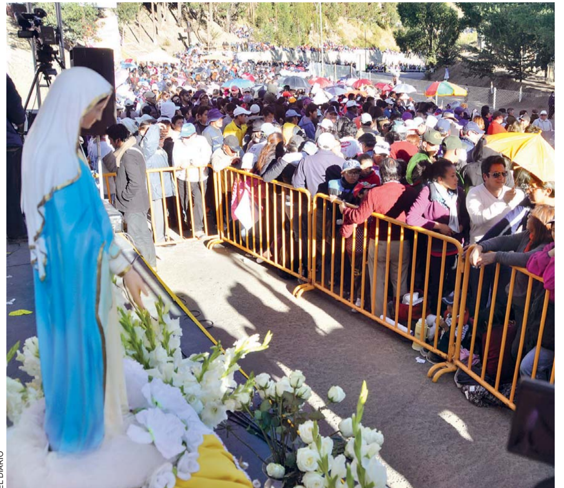
MULTITUD ESPERANDO LA BENDICIÓN DEL SANTO PADRE EN LA CURVA DEL PLAN AUTOPISTA. LA FE CATÓLICA INTACTA EN EL PUEBLO BOLIVIANO.