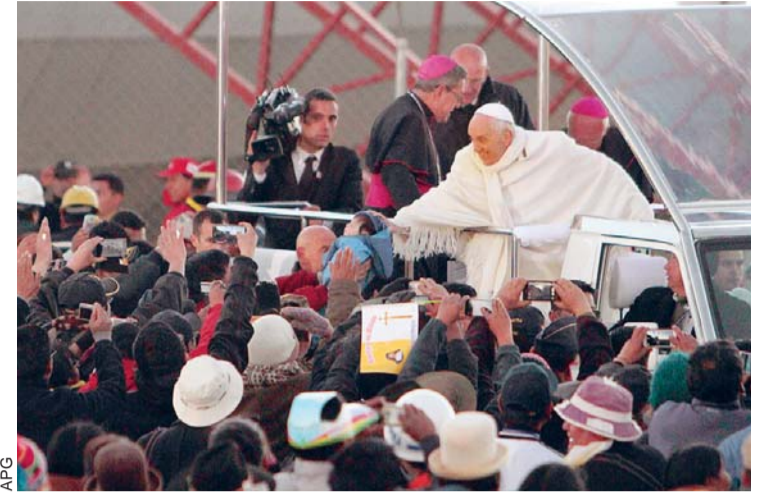
EL SUMO PONTÍFICE TRATÓ DE ALCANZAR A TODOS SUS FELIGRESES.