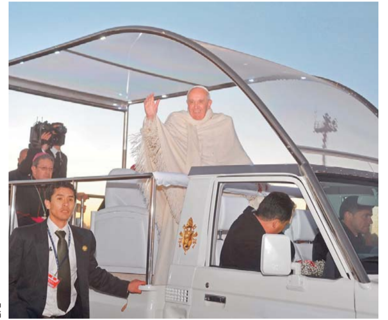
NI EL CLIMA FRÍGIDO DE LA PAZ BORRÓ LA SONRISA DEL ROSTRO DE SU SANTIDAD CUANDO SE DIRIGÍA AL CENTRO PACEÑO.