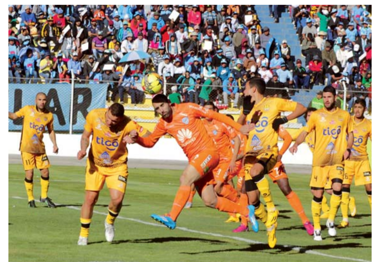
Clásico es para The Strongest

TRAS LAS REVANCHAS DEL TORNEO DE INVIERNO DE LA LIGA QUEDARON DEFINIDOS LOS PLANTELES QUE LOGRARON INGRESAR AL GRUPO DE LOS OCHO MEJORES PARA LOS CUARTOS DE FINAL. THE STRONGEST DERROTÓ AYER POR 1-0 A BOLÍVAR.