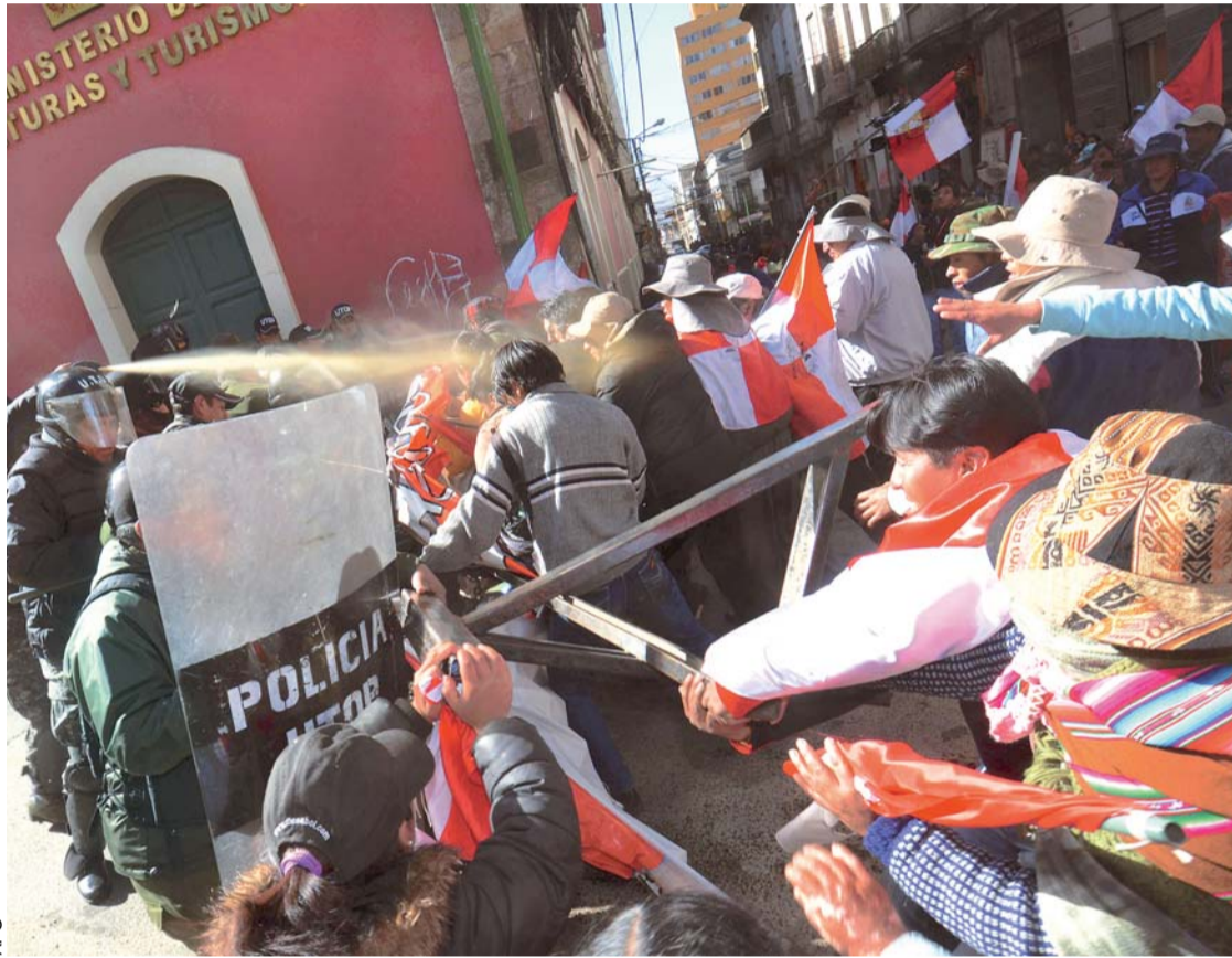
LA MARCHA DE COMCIPO QUE INTENTÓ INGRESAR A LA PLAZA MURILLO FUE GASIFICADA, VARIOS DIRIGENTES SE DESMAYARON Y OTROS QUEDARON HERIDOS.