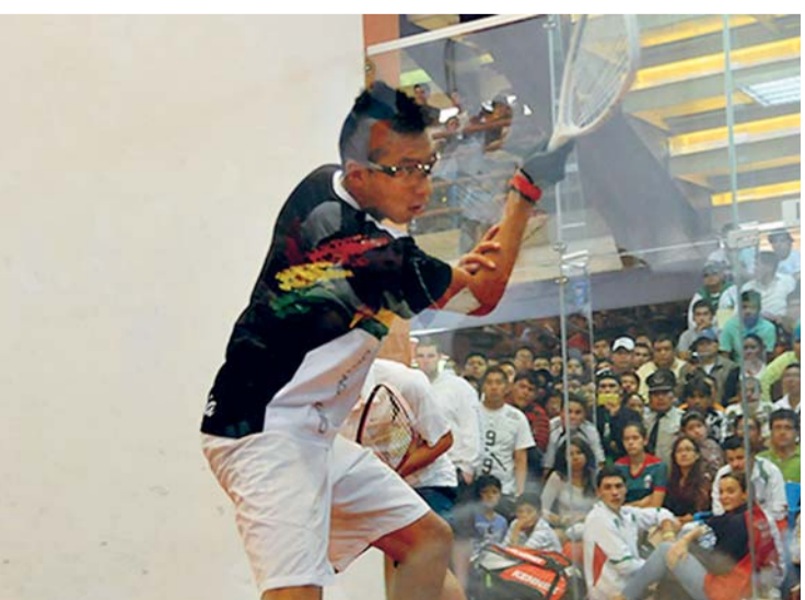
LA DELEGACIÓN DE RÁQUETBOL ASEGURA TRES MEDALLAS PARA BOLIVIA EN LOS JUEGOS PANAMERICANOS.