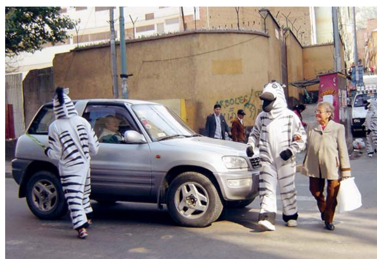
LAS CEBRAS NO SÓLO PRIORIZAN LA EDUCACIÓN VIAL SINO SE CAPACITAN EN SALUD, SEGURIDAD, CULTURA CIUDADANA Y OTROS TEMAS DE INTERÉS SOCIAL.