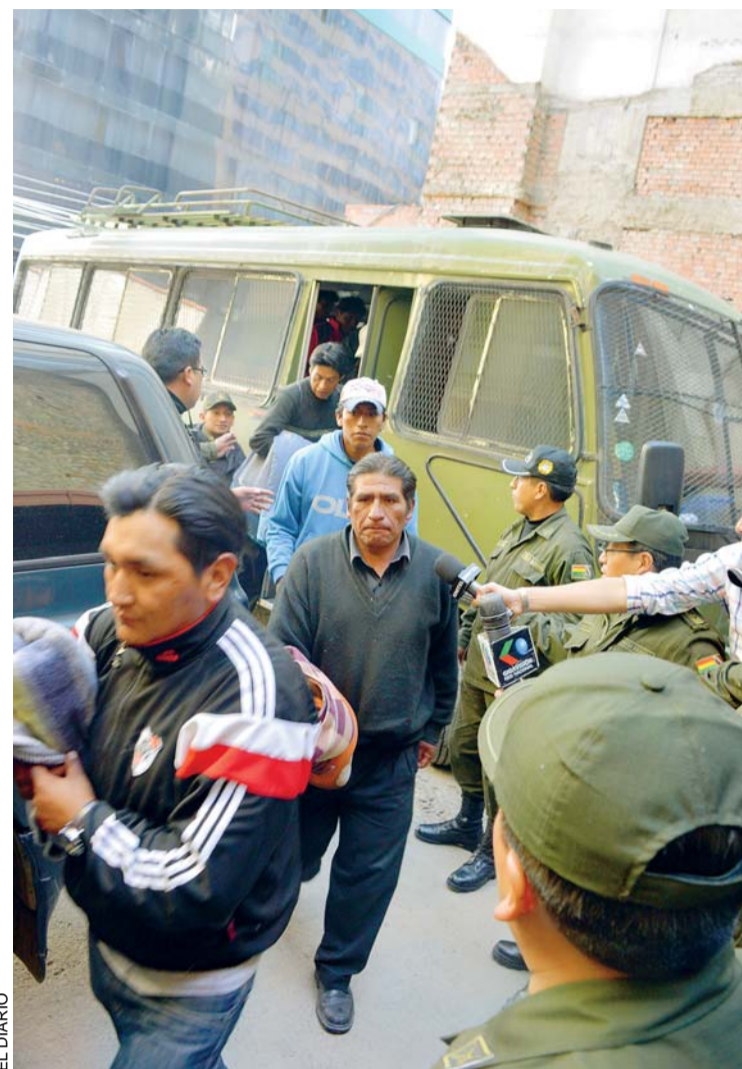
LA JUSTICIA DETERMINÓ LA LIBERTAD DE 47 PERSONAS QUE FUERON APREHENDIDAS DURANTE EL VIOLENTO ENFRENTAMIENTO EN LA PAZ Y CUATRO QUEDAN EN CELDAS.