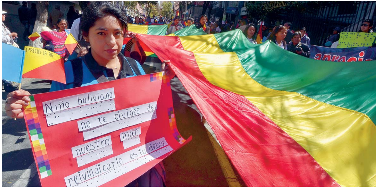
CENTROS Y ESCUELAS PARA NIÑOS CON CAPACIDADES DIFERENTES REALIZARON UN DESFILE EN APOYO A UNA SALIDA SOBERANA AL MAR.

• Con incorporación de los expresidentes Jorge Quiroga, Jaime Paz y Guido Vildoso, el equipo de defensa determinará tareas específicas en torno a la demanda boliviana contra Chile en la Corte Internacional de Justicia de La Haya