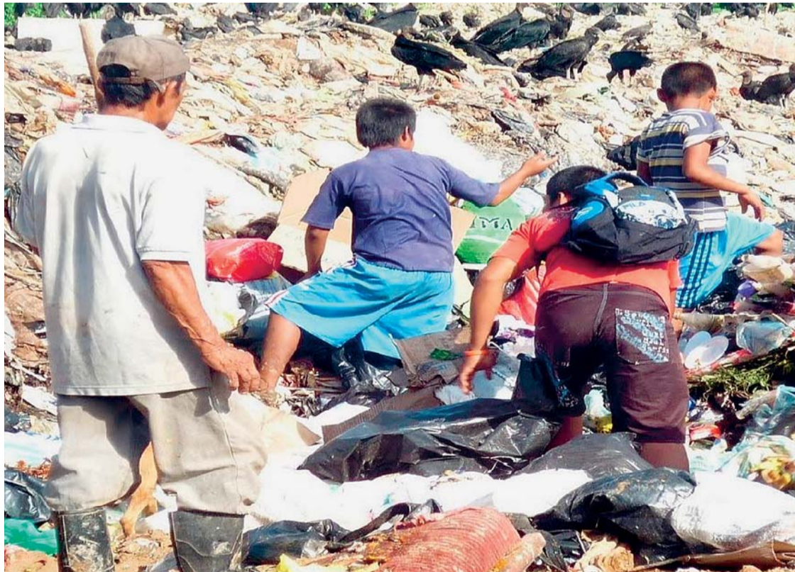
LA ERRADICACIÓN DEL HAMBRE Y POBREZA SON METAS DE LA ONU.

Las Naciones Unidas se proponen vencer el hambre y la pobreza hasta 2030 y garantizar acceso al agua potable y a la formación escolar básica a nivel mundial, informaron los representantes de los 193 países miembros del organismo con sede en Nueva York.