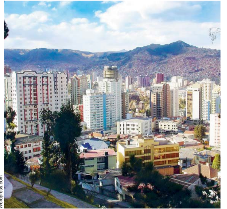
LA SEDE DE GOBIERNO PODRÍA CONVERTIRSE EN “ZONA METROPOLITANA”.

El foro de autoridades departamentales y municipales, desarrollado en Viacha, mostró la predisposición de los participantes en apoyar la creación de la “región metropolitana”.