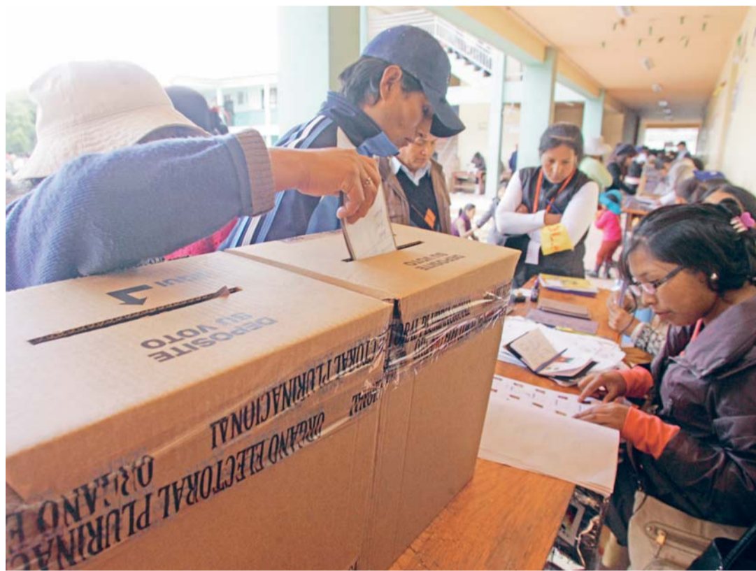
LOS HABITANTES HABILITADOS PARA SUFRAGAR EN LA CONSULTA AUTONÓMICA ACUDIRÁN NUEVAMENTE EL 20 DE SEPTIEMBRE A LAS URNAS PARA EMITIR SU VOTO EN SEIS DEPARTAMENTOS DEL PAÍS.

• El referéndum se desarrollará en La Paz, Chuquisaca, Oruro, Potosí, Cochabamba y Santa Cruz, para el que fueron asignadas 18.314 mesas de sufragio. El TSE habilitó en total a 3.871.766 votantes; inhabilitó a 19.240 personas y depuró del Padrón Electoral a 140.425 fallecidos.