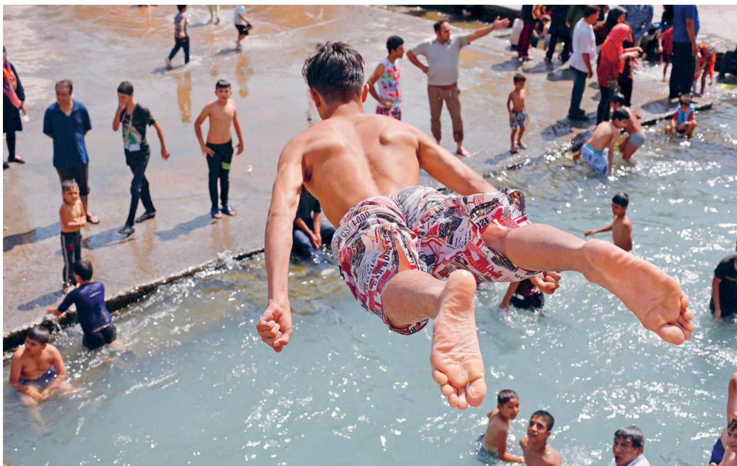
UN JOVEN SALTA AL AGUA MIENTRAS MUCHOS DISFRUTAN DE UN REFRESCANTE BAÑO EN SHAHRE-RAY (IRÁN).