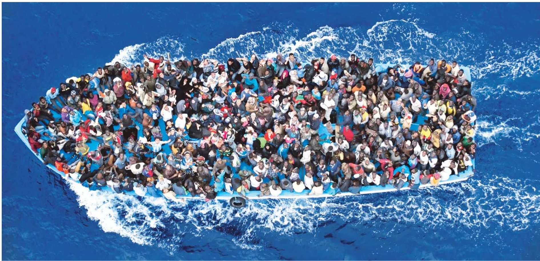
CON ESTA NUEVA OLEADA SE SUMAN 110.000 INMIGRANTES LLEGADOS A ITALIA POR EL MEDITERRÁNEO EN LO QUE VA DE AÑO Y DE ESTOS 89.000 AÚN ESTÁN EN ESTRUCTURAS ITALIANAS.