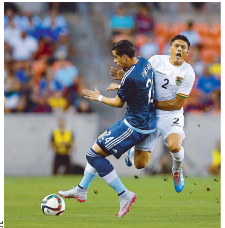
EL JUGADOR MIGUEL HURTADO DE BOLIVIA DISPUTA EL BALÓN CON RAMIRO FUNES MORI (D) DE ARGENTINA.