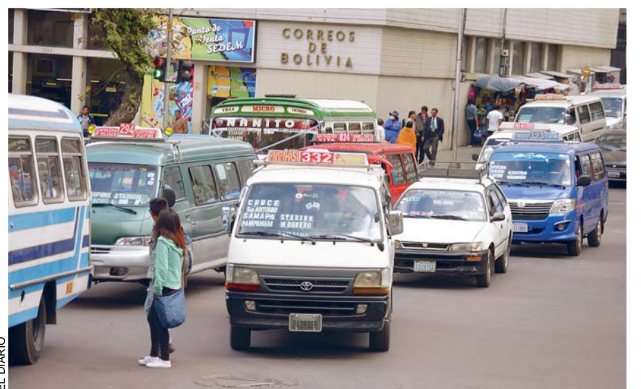
CIUDADANÍA PACEÑA RECHAZA ATROPELLOS DE TRANSPORTISTAS.