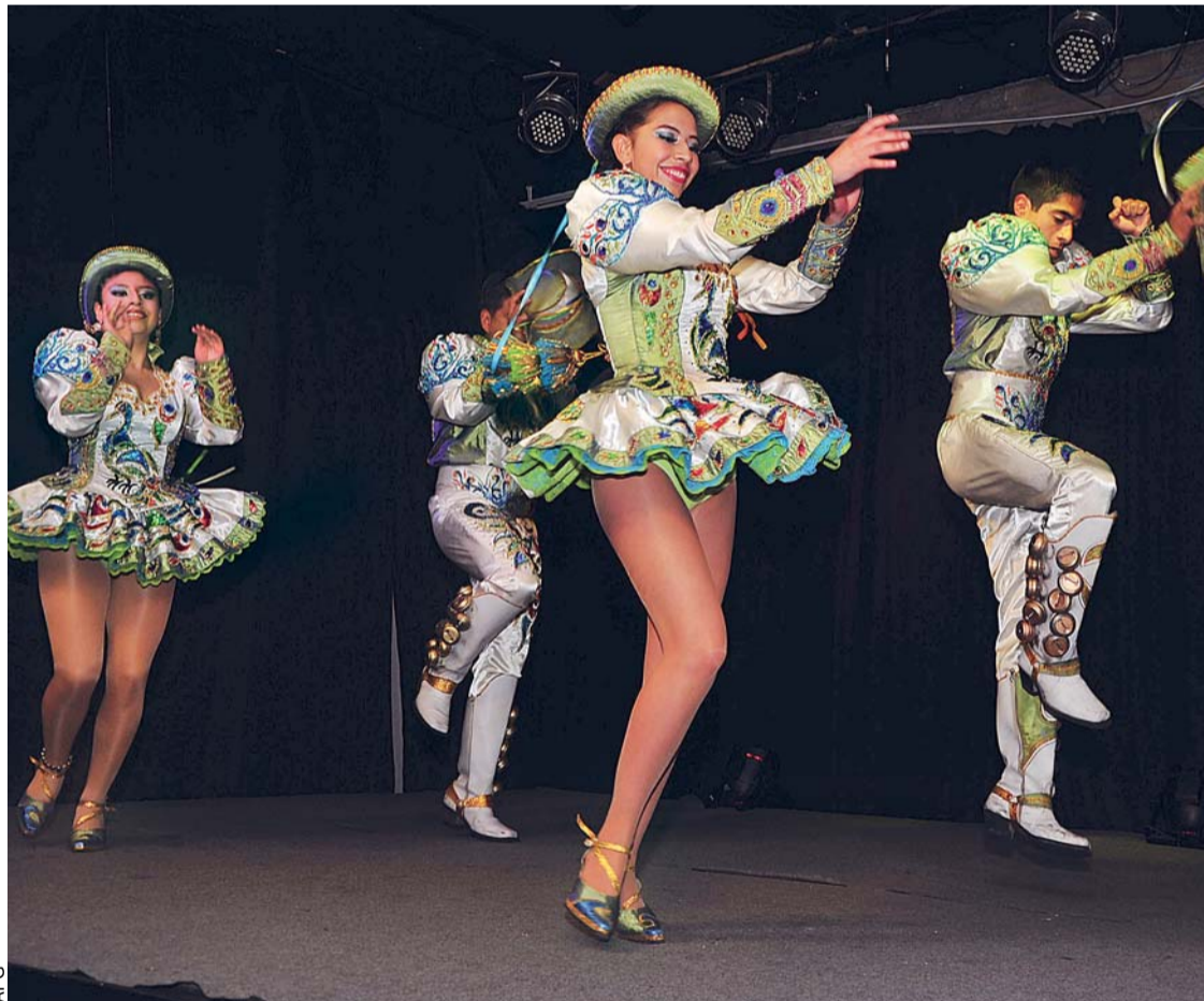
BOLIVIA ORGANIZA EL PRIMER FESTIVAL INTERNACIONAL DE LA DANZA DEL CAPORAL.

El primer Festival Internacional del Caporal, organizado por Bolivia, se desarrollará en el Teatro al Aire Libre Ulises Hermosa de Cochabamba del 10 al 13 de diciembre próximo. El evento se realiza con el objetivo