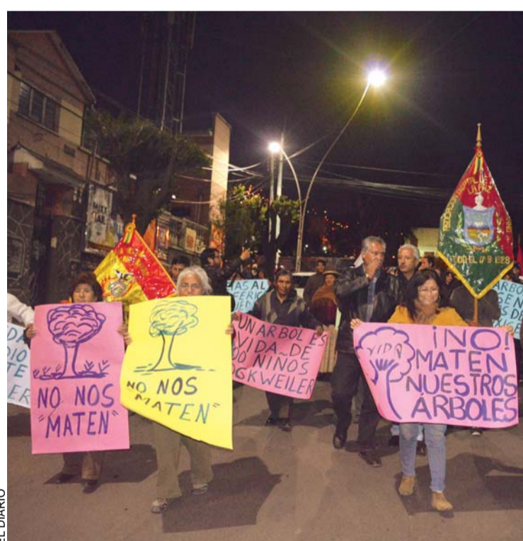
MIRAFLORINOS EXIGEN RESPETO AL MEDIOAMBIENTE Y RECHAZAN LA CONSTRUCCIÓN DEL TELEFÉRICO EN EL SECTOR.

Los vecinos de Miraflores se concentraron en la plaza Villarreal para marchar en contra de la empresa Mi Teleférico por el daño ambiental ocasionado en la zona. La movilización recorrió la avenida Busch y culminó en la plaza Triangular, cuyos representantes manifestaron que continuarán con sus medidas en contra de la implementación del transporte por cable por aquellas céntricas avenidas.