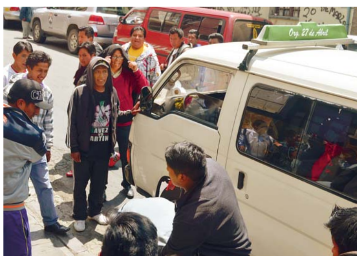
LOS CHOFERES SINDICALIZADOS COMETIERON EXCESOS CONTRA OTROS CONDUCTORES Y BLOQUEARON CALLES, OCASIONANDO PERJUICIOS CONTRA LA CIUDADANÍA PACEÑA.

Hay varias formas muy sencillas de hacer los esmaltes. Puede ser con glitter, con acabado mate y de neón. Mejor ponte manos a la obra y luce tus uñas perfectas.