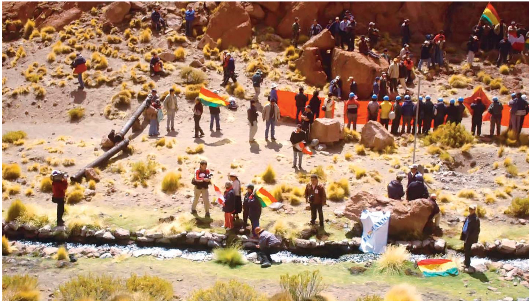
EL ESTADO CHILENO DEBE RESOLVER CON BOLIVIA EL USO ILEGAL DE LAS AGUAS DEL MANANTIAL DEL SILALA, QUE HACE DESDE HACE DÉCADAS NO REALIZA PAGO ALGUNO.

• Existe una agenda densa en las relaciones boliviano-chilenas. El tratamiento de las aguas internacionales del Lauca y del Silala son también parte de la agenda de 13 puntos que se acordó tratar entre ambos países en 2006. La relación bilateral contempla más que el asunto marítimo.