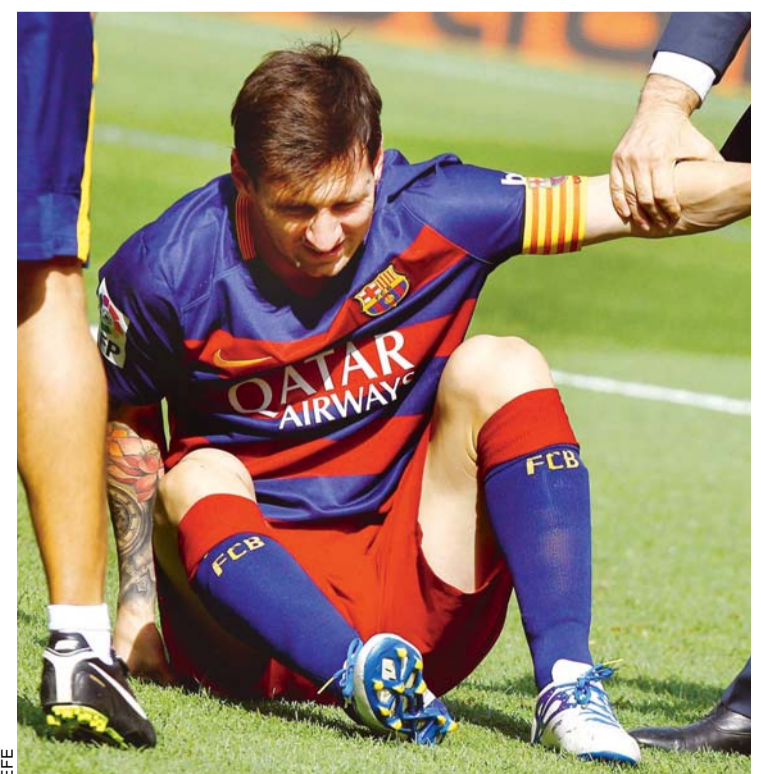
EL SÚPER ASTRO DEL FÚTBOL MUNDIAL, LIONEL MESSI, AYER SUFRIÓ UNA LESIÓN QUE LO MANTENDRÁ ALEJADO DE LAS CANCHAS.