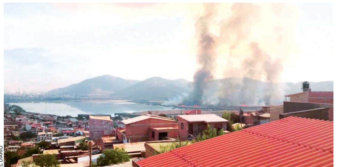
LA LAGUNA ALALAY DE COCHABAMBA FUE LA MÁS AFECTADA POR LOS INCENDIOS FORESTALES.