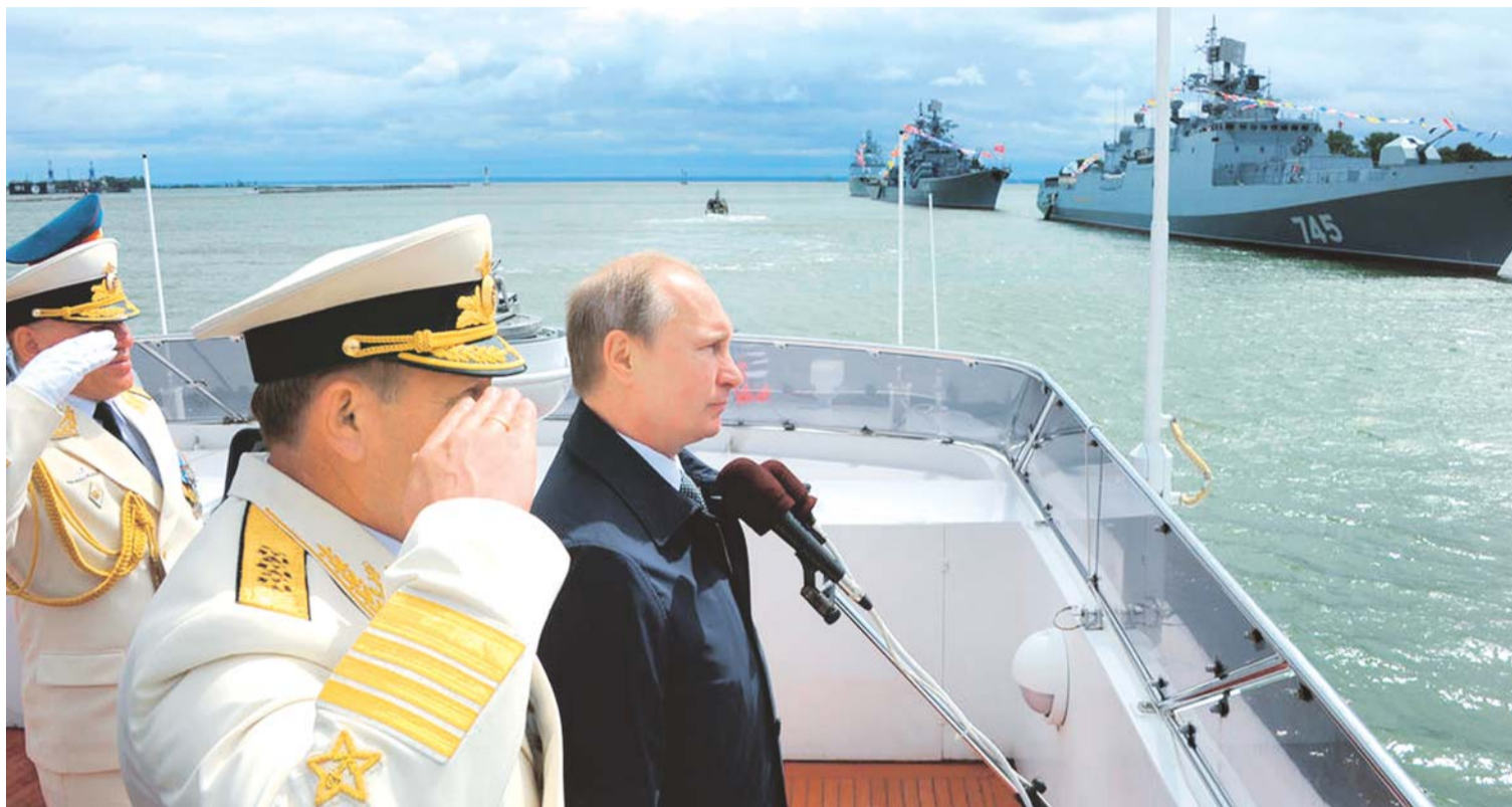
EL ARMAMENTISMO RUSO SE ESTÁ PONIENDO DE MANIFIESTO EN EL DESPLIEGUE DE ARMAS DE ÚLTIMA GENERACIÓN SOBRE EL TERRITORIO DE SIRIA. AYER FUERON ATACADOS POR AIRE Y MAR 27 OBJETIVOS. EN LA FOTO, VLADIMIR PUTIN Y UN JEFE MILITAR OBSERVAN NAVES QUE SE ESTÁN UTILIZANDO PARA LANZAR MISILES.