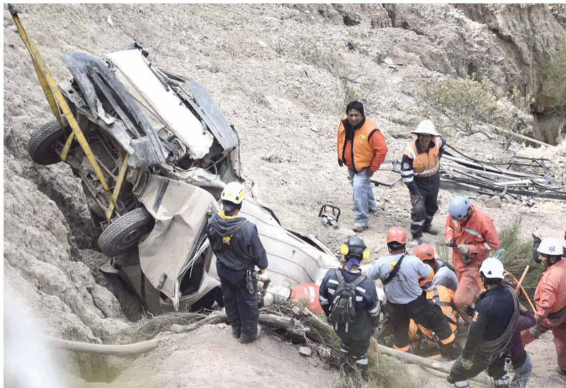
EFFECTIVOS DE LA UNIDAD DE BOMBEROS DE LA ZONA SUR RESCATARON A SEIS PASAJEROS DE UN MINIBÚS CON GRAVES HERIDAS Y LOS CUERPOS DE OTROS SEIS QUE PERDIERON LA VIDA.