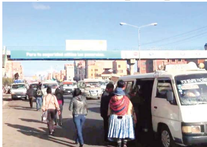
EL SERVICIO DEFICIENTE DEL TRANSPORTE PÚBLICO CAUSA MOLESTIA DE LOS CIUDADANOS.

Ante anuncios de trasportistas de radicalizar sus medidas de protestas, la ciudadanía expresó su molestia, debido a que estas acciones perjudican el desarrollo de varias actividades, por lo que consideran que el pésimo servicio que presta el transporte público en La Paz y El Alto no justifica un incremento de tarifas.