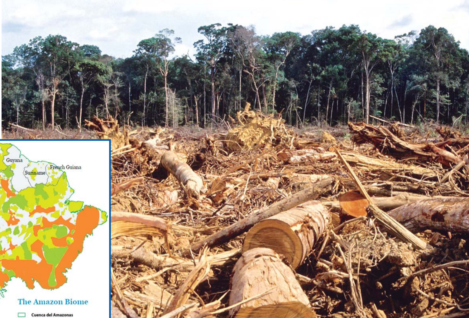
LA DEFORESTACIÓN SE DA EN EL PAÍS, PRINCIPALMENTE, POR LA EXPANSIÓN DE LA AGRICULTURA MECANIZADA, SEGUIDA DE LA GANADERÍA, LA AGRICULTURA A PEQUEÑA ESCALA, ADEMÁS DE LA PRESENCIA DE COLONOS.