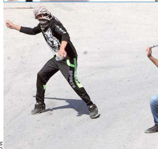
LOS DISTURBIOS Y ATAQUES CONTINUARON AYER EN ISRAEL Y PALESTINA, CON ENFRENTAMIENTOS EN MANIFESTANTES Y POLICÍAS.

y se saldó con la muerte del agresor, que había resultado en un principio herido crítico por disparos de fuerzas de seguridad israelíes, informó la Policía local.