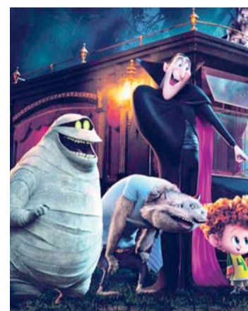
PERSONAJES QUE SERÁN PARTE DE LA FIESTA.

Con el propósito de estimular la creatividad y diversión de nuestros niños, EL DIARIO, en Halloween 2015, presentará la novedosa propuesta de una toma de fotografías con los principales personajes de "Hotel Transylvania 2".