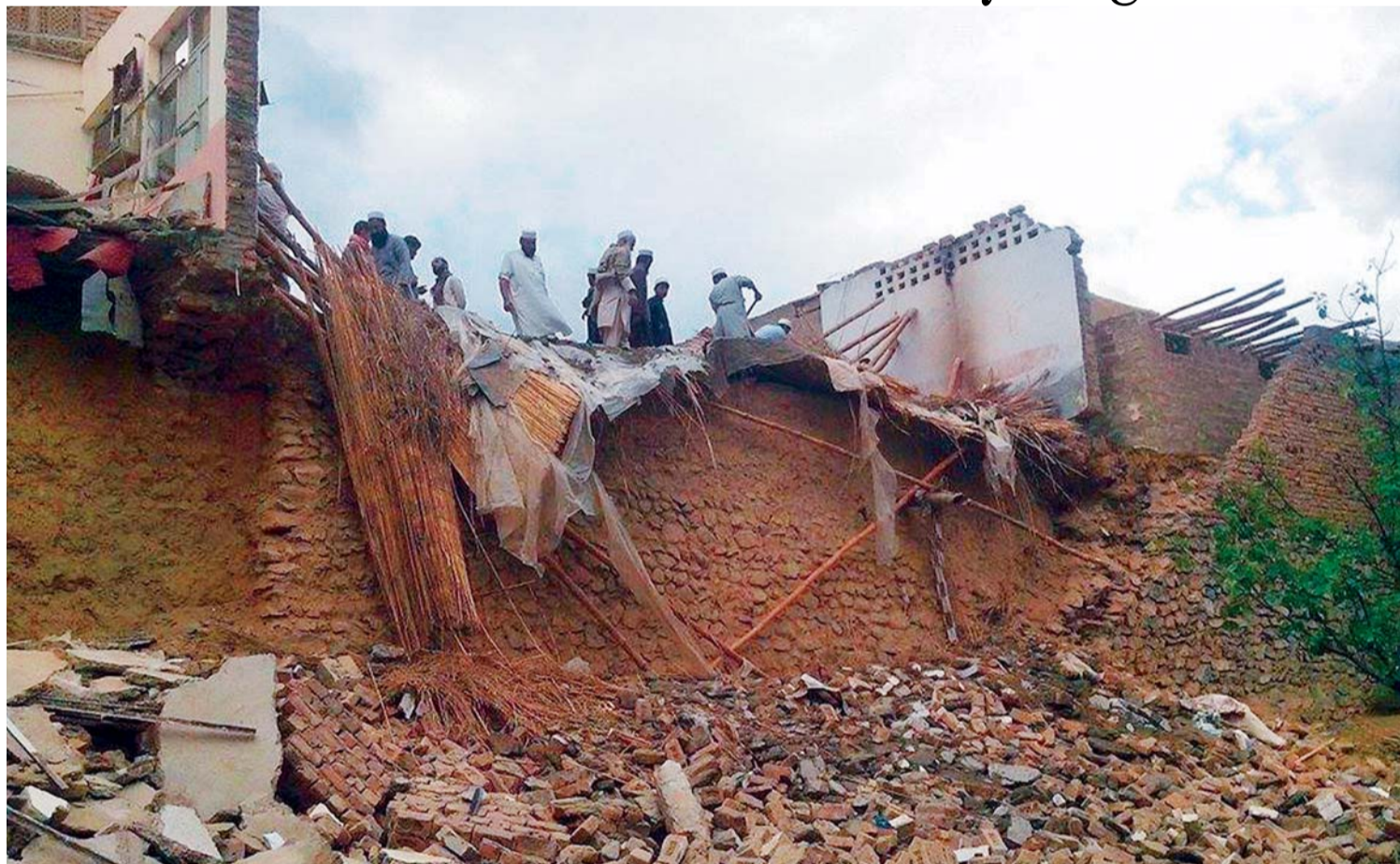
OTRO DESASTRE NATURAL GOLPEÓ AL MUNDO AYER, CUANDO LA TIERRA TEMBLÓ EN AFGANISTÁN Y CAUSÓ MÁS DE 200 MUERTES.

Un terremoto de 7,5 grados, en la escala de Richter, golpeó ayer el norte de Afganistán y se sintió incluso en India y Pakistán; se informó sobre más de 200 muertos y miles de personas fueron evacuadas a edificios, en ciudades como Nueva Delhi e Islamabad.