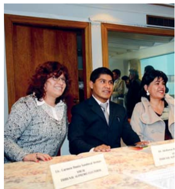
VOCALES DEL TSE.