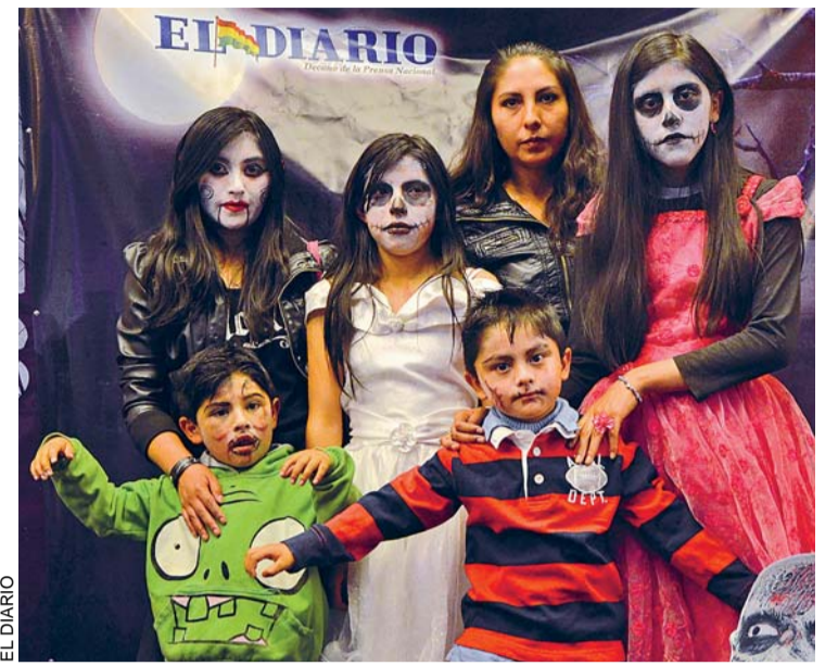
EN LA FIESTA DE HALLOWEEN, LOS NIÑOS CUENTAN CON LAS CÁMARAS DE EL DIARIO PARA PLASMAR SU INGENIO EN UNA REVISTA DE LUJO Y A TODO COLOR.