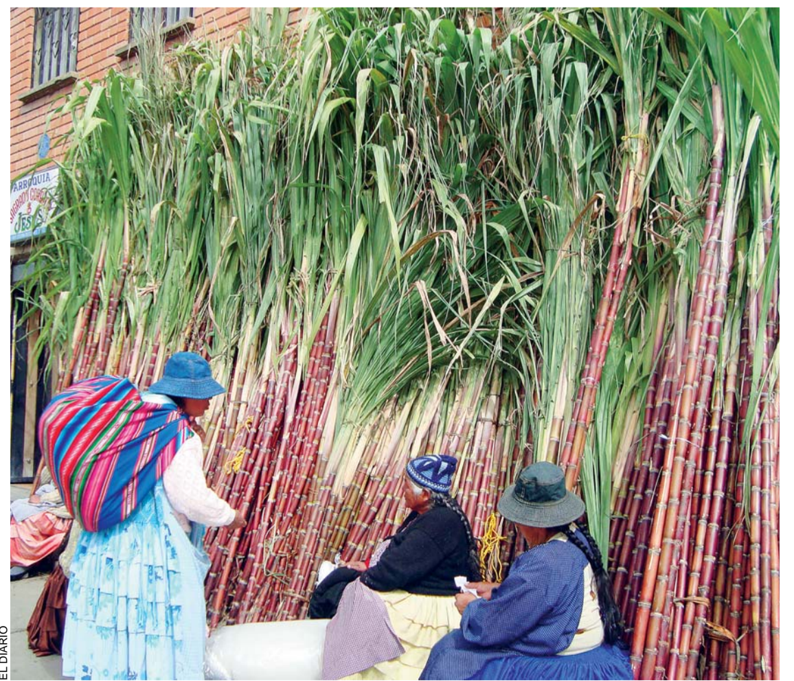
AUMENTA VENTAS DE INSUMOS PARA EL ARMADO DE MESAS DE TODOS SANTOS. UNO DE LOS ELEMENTOS INDISPENSABLES ES LA CAÑA DE AZÚCAR.