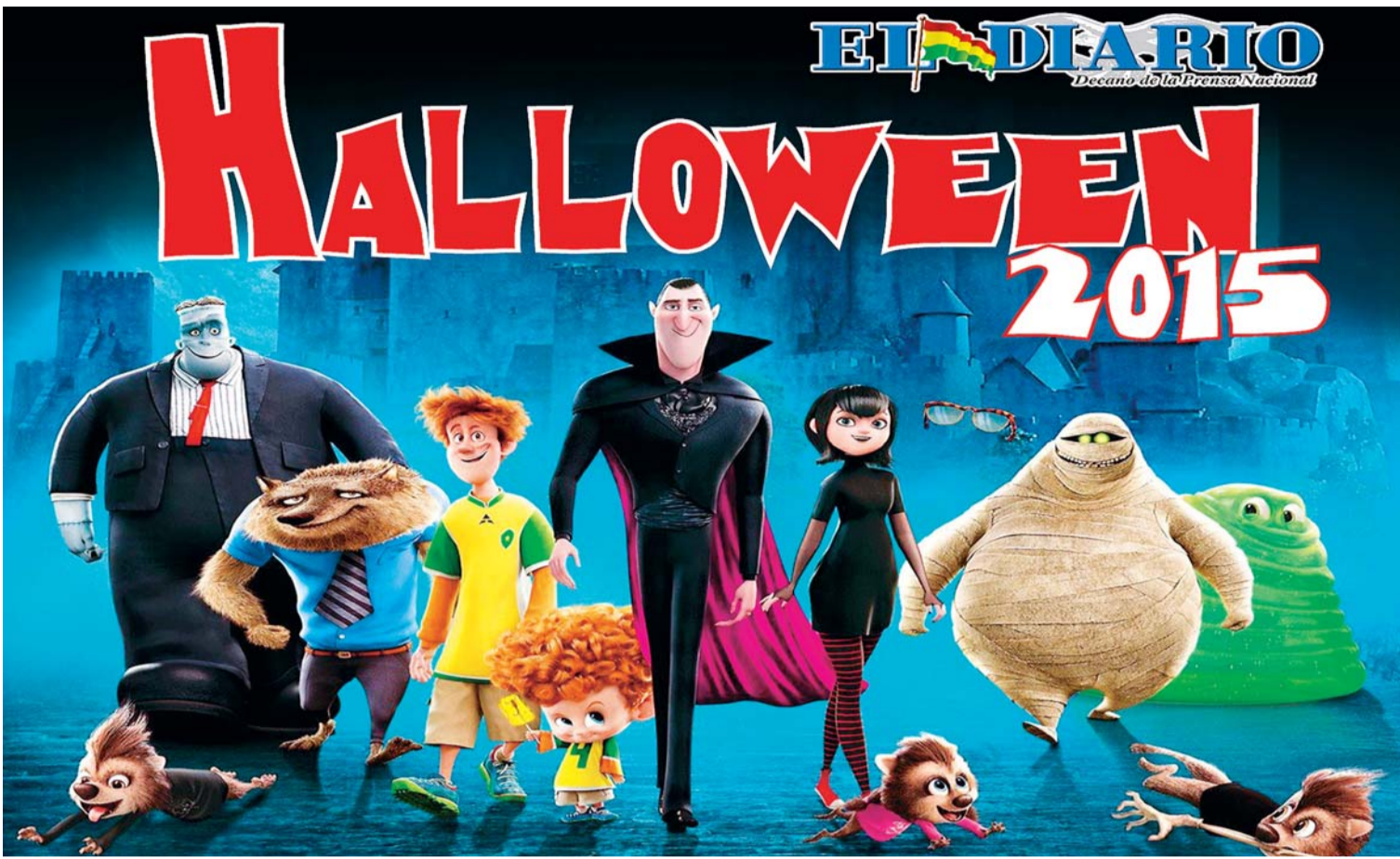
LA FIESTA MÁS ESPECTACULAR DE HALLOWEEN ESTÁ ORGANIZADA POR EL DIARIO, QUE HOY A PARTIR DE LAS 14:00 HORAS INVITA A TODOS AL MULTICINE.