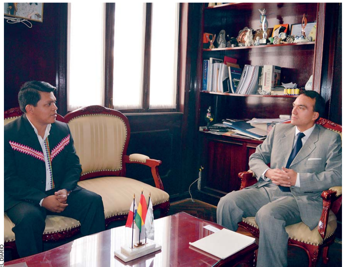
Embajador de Panamá visitó EL DIARIO