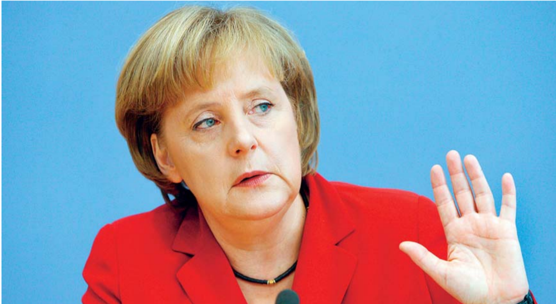
ANGELA MERKEL, CANCELLER ALEMANA, SE REFIRIÓ A LA RELACIÓN BOLIVIA-CHILE.

La canciller alemana Angela Merkel dijo ayer que Bolivia y Chile deben dialogar para solucionar la demanda marítima del país. Aseguró que se debe retomar conversaciones de largo plazo sobre la causa.