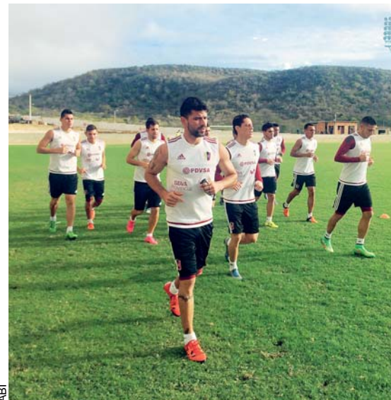
SELECCIONADOS DE BOLIVIA Y VENEZUELA ENTRENAN PARA ENFRENTARSE ENTRE SÍ, EL PRÓXIMO JUEVES EN LA PAZ.