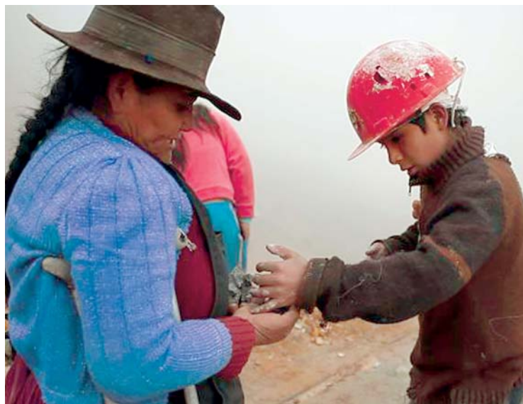
IMAGEN DEL DOCUMENTAL LA "MINERITA", DE RAÚL DE LA FUENTE.