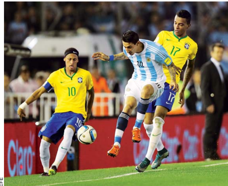
Argentina y Brasil empataron

ARGENTINA Y BRASIL IGUALARON AYER EN EL MARCADOR (1-1) EN BUENOS AIRES. EXISTE PREOCUPACIÓN DEL EQUIPO ALBICELESTE POR LAS ELIMINATORIAS SUDAMERICANAS DEL PRÓXIMO MUNDIAL, EN LAS QUE TODAVÍA NO GANA, AUNQUE SU RIVAL TAMPOCO TERMINA POR CONVENCER.