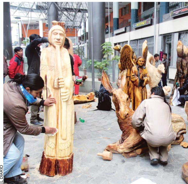
Pesebre gigante para La Paz

LAS 13 PIEZAS DE UN PESEBRE, TALLADOS EN MADERA, CON DIMENSIONES DE MÁS DOS METROS, SERÁN PARTE DE LOS ADORNOS NAVIDEÑOS DEL MUNICIPIO Y SERÁN UBICADOS EN UN LUGAR AÚN POR DEFINIR. DE ESTA FORMA SE INICIAN ALGUNAS DE LAS ACTIVIDADES DE NAVIDAD PARA ESTE AÑO EN LA PAZ, CIUDAD MARAVILLA.