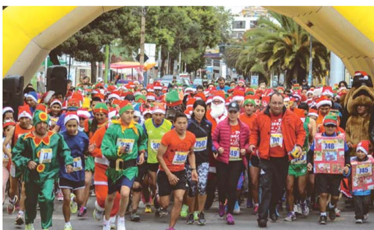
SALIDA DE LOS ATLETAS NAVIDEÑOS.

Participaron más de 800 personas, familias enteras y muchos grupos, mostrando esfuerzo y entusiasmo. Los tres primeros puestos recibieron medallas y premios especiales de los auspiciadores.