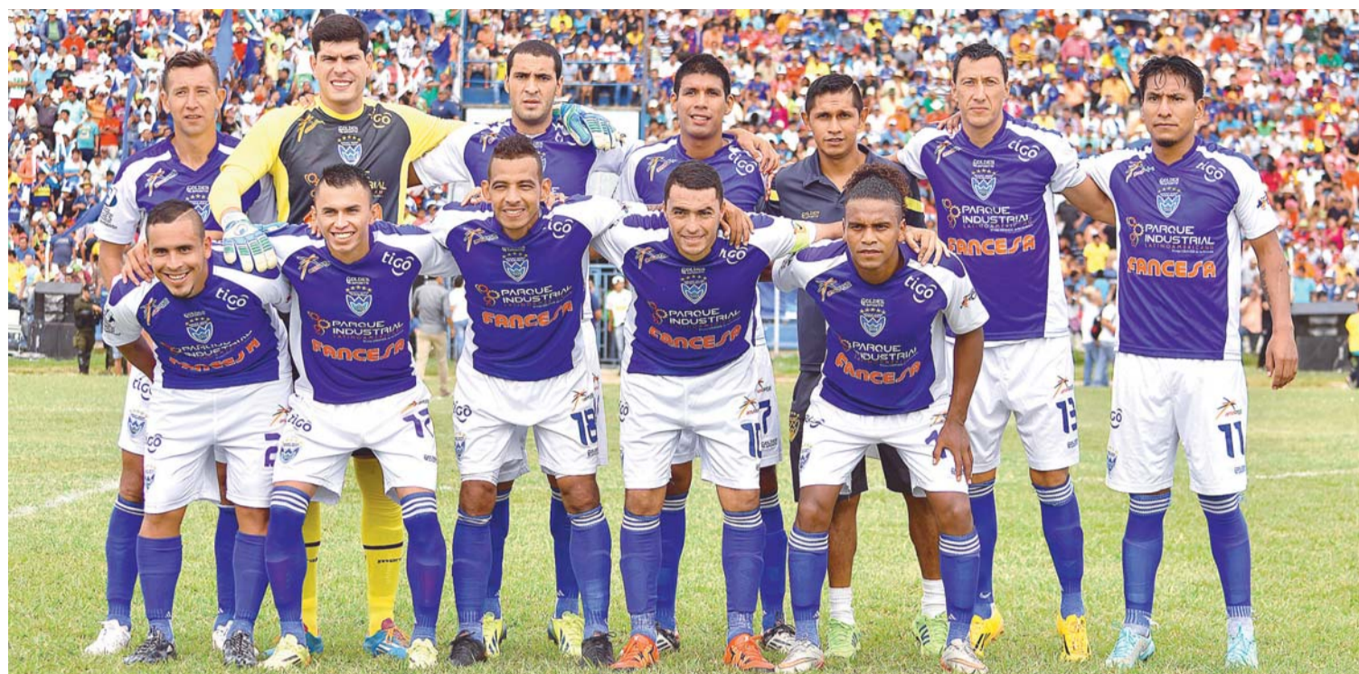
Sport Boys campeón del fútbol profesional boliviano

EL REPRESENTANTE WARNEÑO, SPORT BOYS AYER SE CONSAGRÓ CAMPEÓN POR PRIMERA VEZ EN LA LIGA DE FÚTBOL PROFESIONAL BOLIVIANO TRAS VENCER A CICLÓN POR 3-0, EN LA VIGÉSIMA SEGUNDA FECHA DEL TORNEO APERTURA.