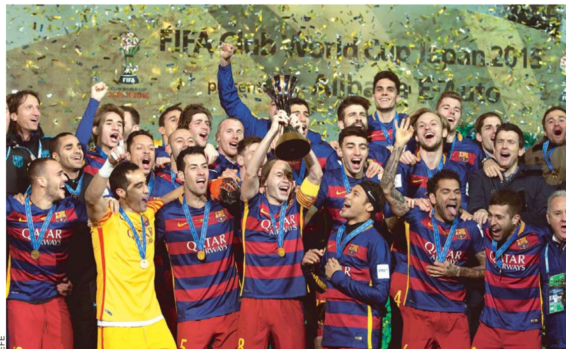
FESTEJO DE BARCELONA QUE LOGRÓ COLOCARSE EN LA CÚSPIDE DEL FÚTBOL MUNDIAL.

Barcelona se proclamó campeón del mundo de clubes y completó un casi perfecto 2015, con notable colección de títulos. Después de ganar Copa, Liga, Champions y Supercopa de