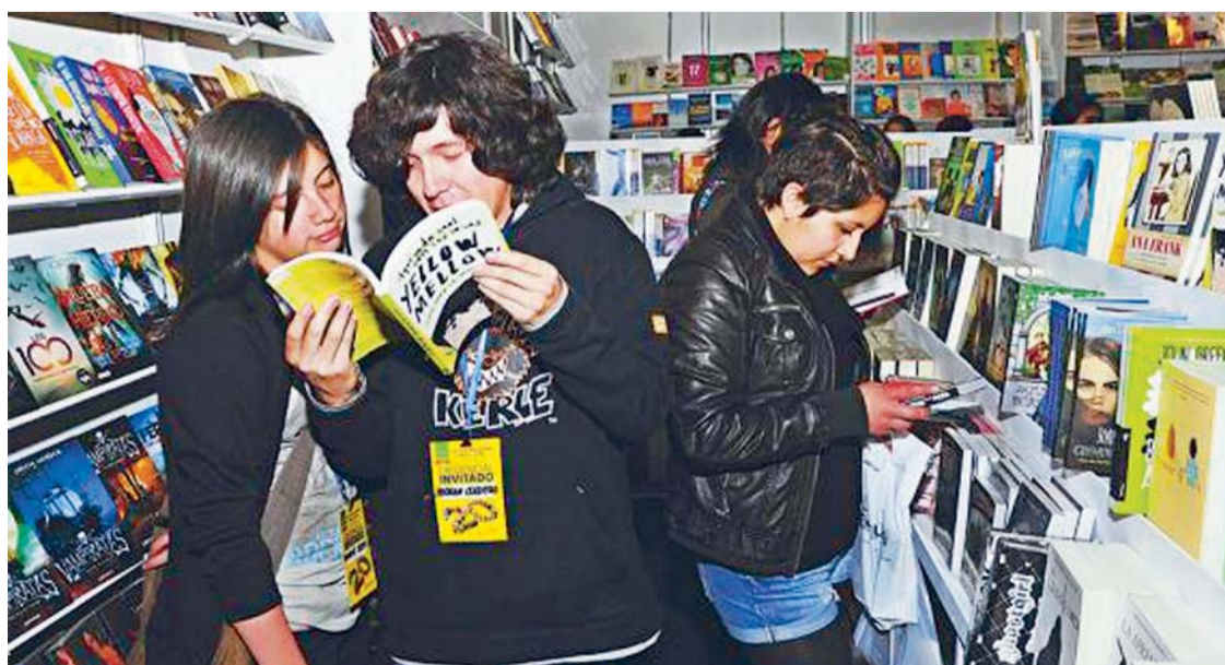
LAS OFERTAS ESTÁN ACORDES A GUSTOS DE GÉNEROS Y PRECIOS PARA LOS AMANTES DE LA LITERATURA.

'Ya te extraño' con Drew Barrymore y Toni Collette, nos vuelven a demostrar lo que son capaces de hacer en una historia sobre la amistad incondicional.