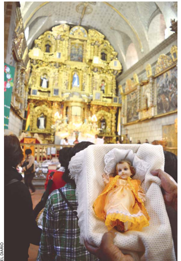
EL DÍA DE LOS REYES MAGOS CIERRA LAS FIESTAS NAVIDEÑAS. LOS NIÑITOS FUERON BENDECIDOS EN LAS IGLESIAS CATÓLICAS.