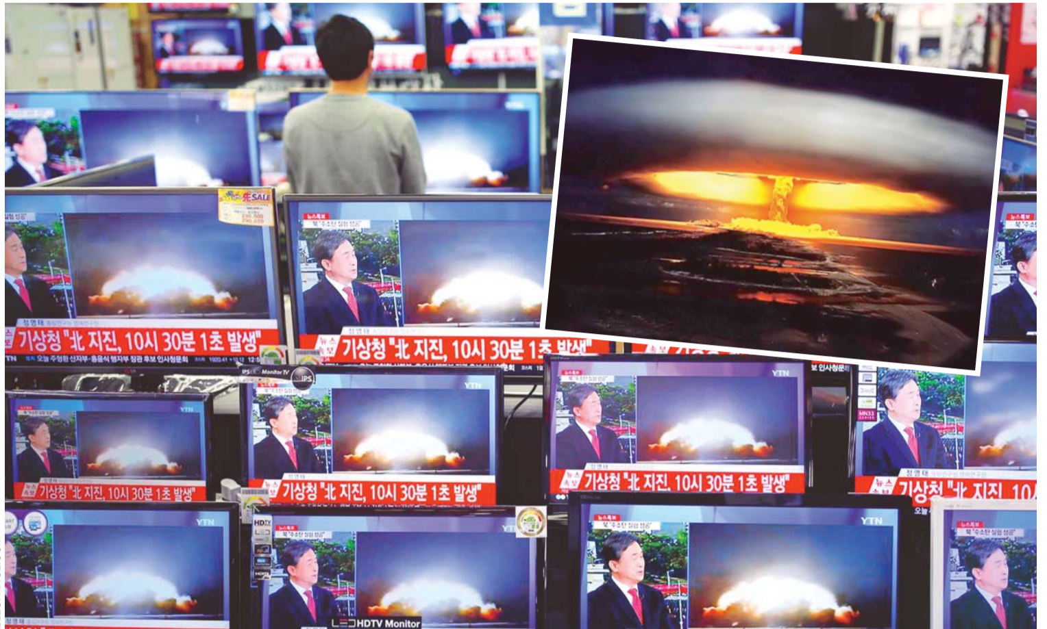
UNA TIENDA DE ELECTRÓNICA DE SEÚL MUESTRA LA COBERTURA DEL DESAFÍO NUCLEAR DE COREA DEL NORTE.