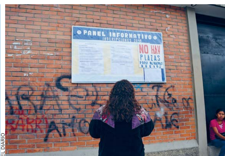
PESE A LA RECOMENDACIÓN DEL MINISTRO DE EDUCACIÓN, EN ALGUNAS UNIDADES ESCOLARES SE PERCIBIÓ QUE ANTES DE LAS INSCRIPCIONES YA NO EXISTEN PLAZAS LIBRES.