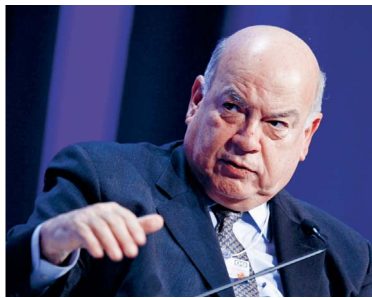
JOSÉ MIGUEL INSULZA IMPULSA NUEVA ESTRATEGIA PARA PRESENTAR LA POSTURA CHILENA ANTE LA CORTE INTERNACIONAL DE JUSTICIA DE LA HAYA.