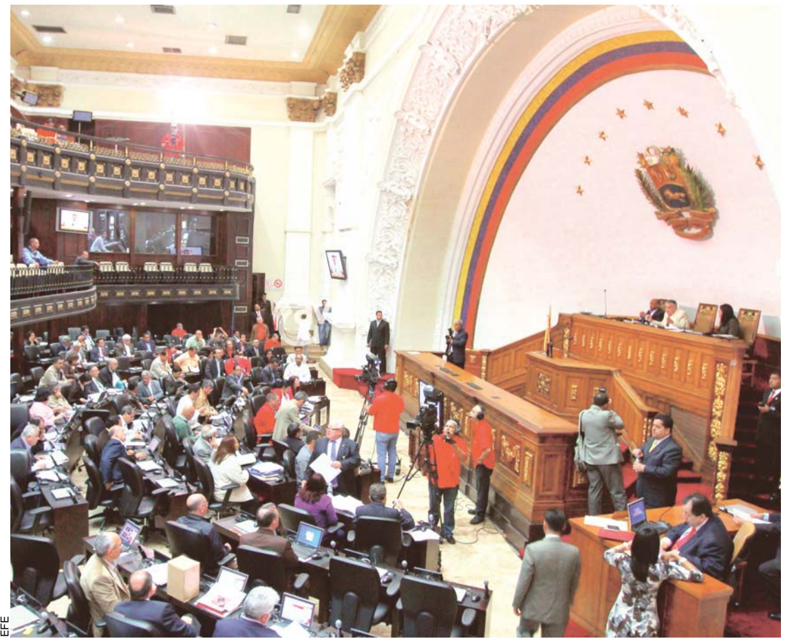
PARLAMENTO DE LA REPÚBLICA BOLIVARIANA DE VENEZUELA QUE SE OPUSO Y RECHAZÓ DECRETO DE MADURO.