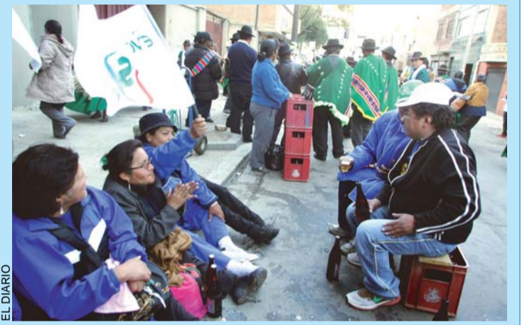
FESTEJO Y ALGARABÍA DE LOS MOVIMIENTOS SOCIALES EN LAS CALLES DE LA SEDE DE GOBIERNO.