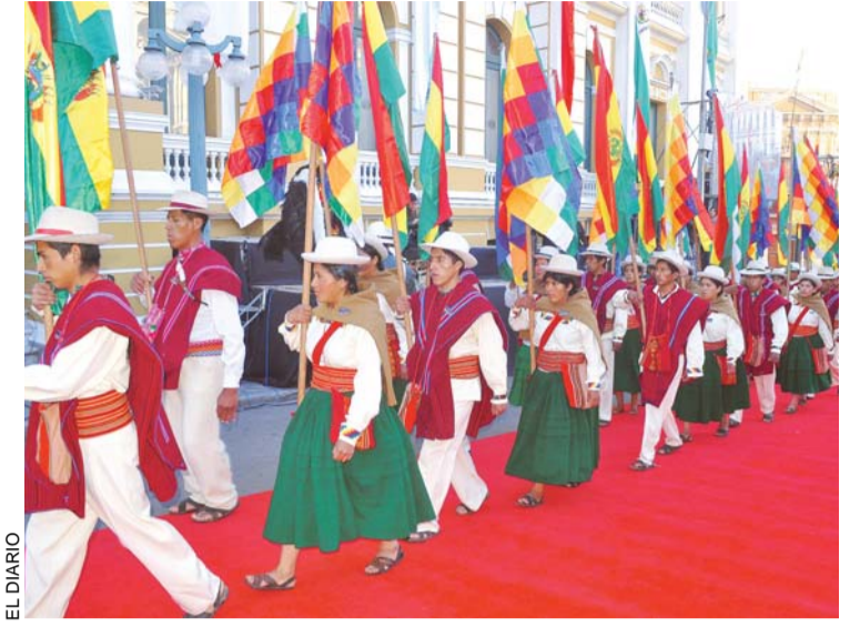
TRES INSTANCIAS DE LA JORNADA DE ANIVERSARIO DEL ESTADO. EL PRIMER MANDATARIO SE CONSTITUYÓ EN EL CENTRO DE ATENCIÓN POR LAS CASI SEIS HORAS DE DISCURSO. LUEGO ORGANIZACIONES SOCIALES DESFILARON FRENTE AL PALCO DEL PALACIO DE GOBIERNO.