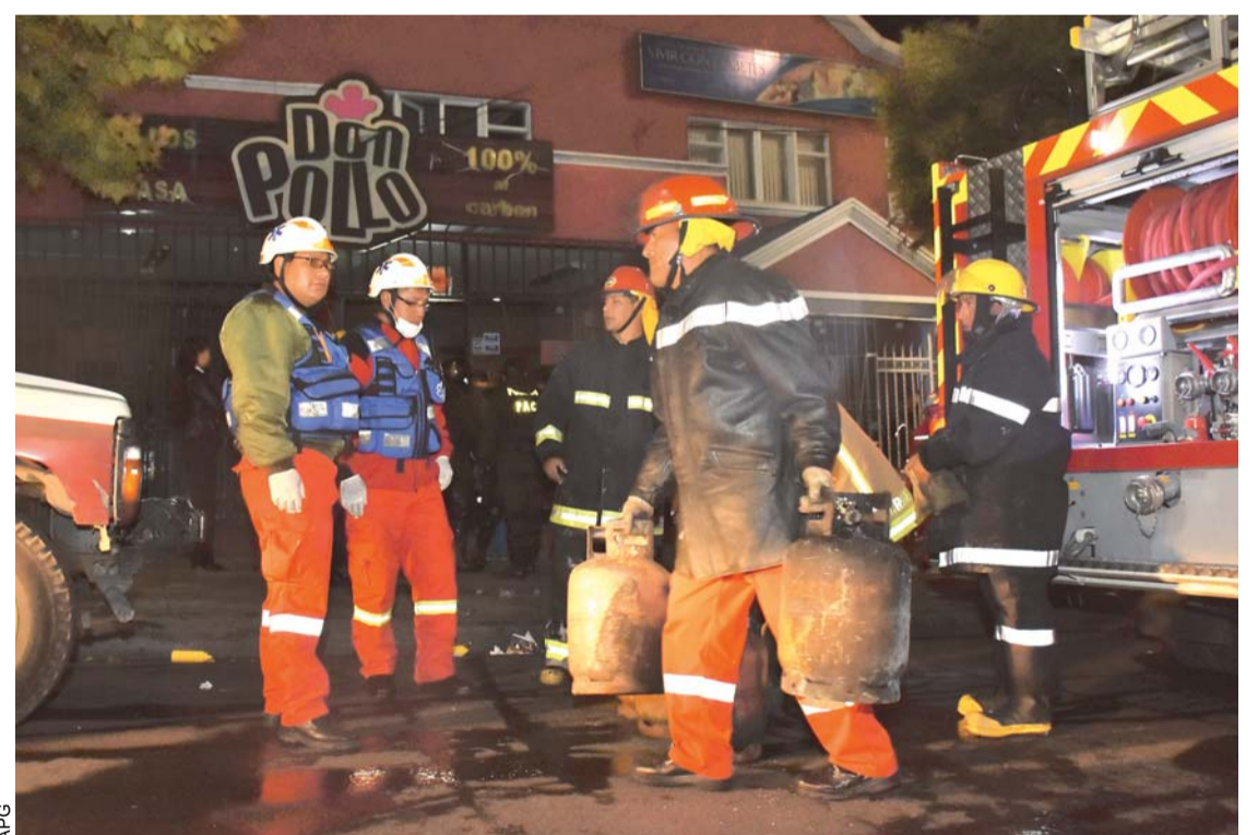
BOMBEROS LOGRARON CONTROLAR EL INCENDIO EN LA ZONA MIRAFLORES.