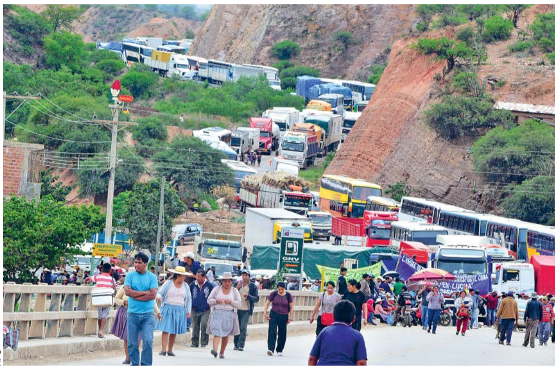
EN LA POBLACIÓN DE PAROTANI, DISTANTE A 30 KILÓMETROS DE LA CIUDAD, SE REGISTRA EL BLOQUEO MÁS CONTUNDENTE DEL TRANSPORTE PESADO. CIENTOS DE VEHÍCULOS VARADOS EN LA CARRETERA BLOQUEAN EL PASO.