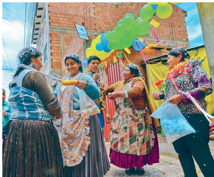
TRADICIÓN Y ALEGRÍA CARACTERIZARON LA CH'ALLA, ACTIVIDAD CON LA QUE CONCLUYÓ EL CARNAVAL.

Según la tradición boliviana, ayer se festejó el Martes de Ch'alla, festividad con la que se puso punto final al carnaval, con lo que concluyó el tiempo de diversión, desenfreno y desahogo, para ingresar a una etapa espiritual y preparatoria de las actividades conmemorativas de la Semana Santa.