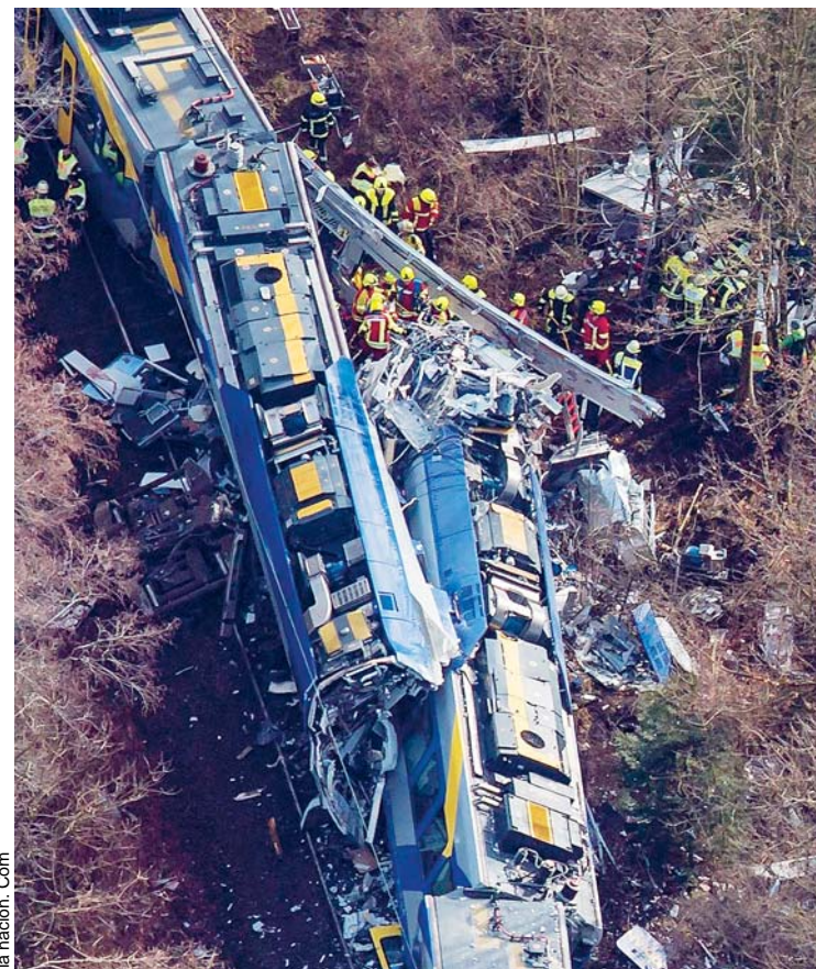
IMAGEN MUESTRA LA MAGNITUD DEL CHOQUE ENTRE TRENES. OCURRIÓ AYER EN ALEMANIA.