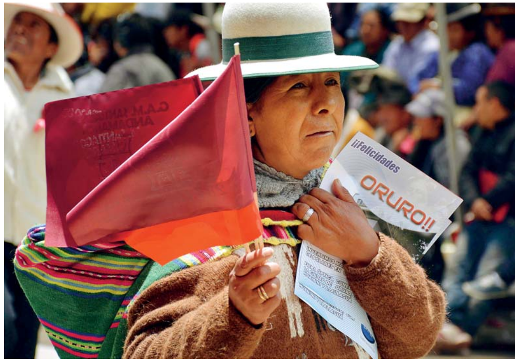
EL PUEBLO ORUREÑO AGUARDA PACIENTE LA LLEGADA DEL DESARROLLO A SU DEPARTAMENTO Y TIENE ESPERANZAS DE QUE LAS PROMESAS SE HARÁN REALIDAD.

Oruro conmemora hoy 235 años de la Revolución del 10 de Febrero de 1781, fecha histórica que cierra también el carnaval de la presente gestión, que atrajo a miles de turistas para presenciar la magnífica entrada del sábado pasado.