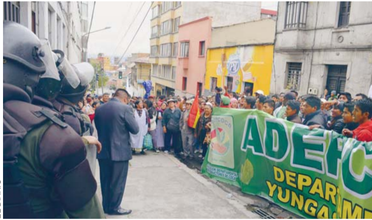
EFFECTIVOS POLICIALES DETUVIERON A CERCA DE CUATRO DECENAS DE COCALEROS DE LA REGIÓN DE LOS YUNGAS.

Por otro lado, el ministro de Desarrollo Rural y Tierras, César Cocarico, dijo que llamó a la Asociación Departamental de Productores de Coca (Adepcoca) al diálogo antes que este sector concrete el bloqueo de caminos con el que pretenden exigir el cumpli-