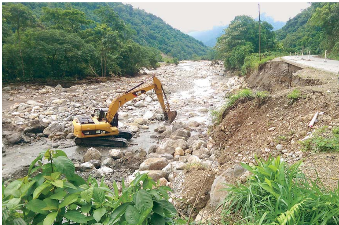
LA RUTA LA PAZ - APOLO SE ENCUENTRA CON VARIOS DESLIZAMIENTOS, LO QUE HACE INTRANSITABLE A LA REGIÓN DE LOS YUNGAS.