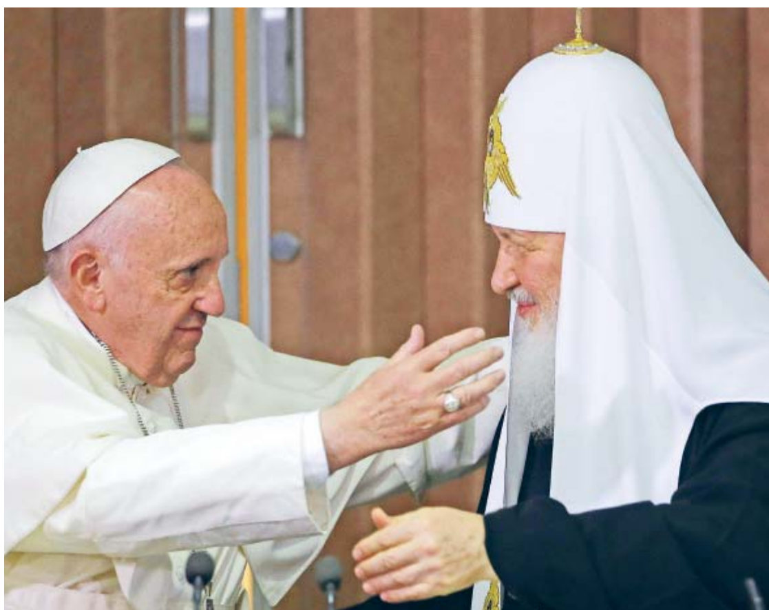
EL PAPA FRANCISCO ABRAZA AL PATRIARCA ORTODOXO RUSO KIRIL (D), EN EL AEROPUERTO JOSÉ MARTÍ DE LA HABANA (CUBA).