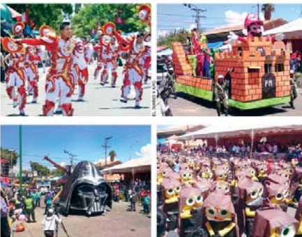
INSTANCIAS DE INGENIO, ALEGRÍA, ENTUSIASMO Y JUVENTUD QUE EXHIBIÓ EL CORSO DE CORSOS. FUE AYER EN COCHABAMBA.