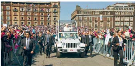
PAPA FRANCISCO SE RECIBIÓ POR LA MULTITUD EN MÉXICO, DONDE EXTERIORIZÓ PREOCUPACIÓN POR PROBLEMAS SOCIALES Y LLAMÓ A UNIR ESFUERZOS PARA DERROTAR EL PELIGRO DEL NARCOTRÁFICO.