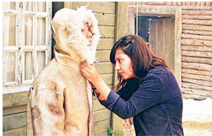
MAITE TARILONTE LOGRA SU SEGUNDO PREMIO GOYA.