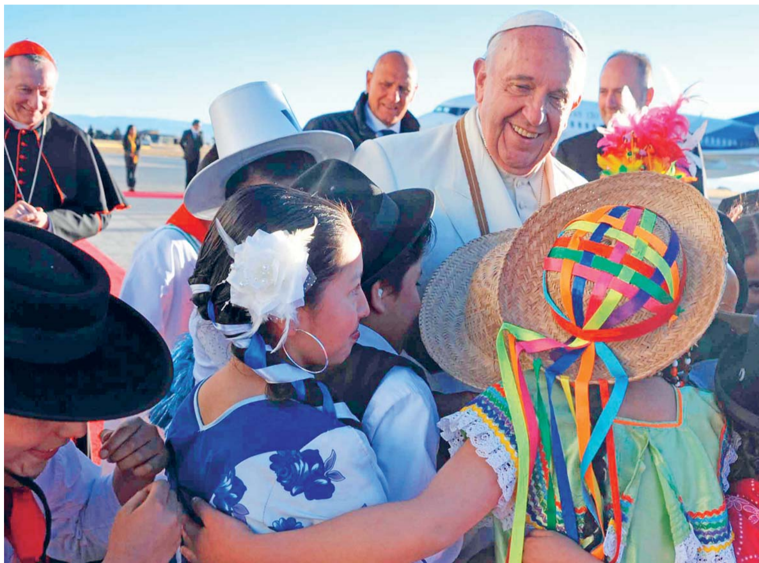
FAMILIAS DE INDÍGENAS TOJOLABALES Y ZOQUES ENTREGARON OFRENDAS DE PAN Y VINO, MIENTRAS OTROS MOSTRARON AL PONTÍFICE EL DINERO RECAUDADO PARA CONSTRUIR DOS ALBERGUES PARA MIGRANTES.

• Jorge Mario Bergoglio pronunció en Chiapas un duro alegato contra "el dolor, el maltrato y la inequidad" e instó a que los gobernantes pidan perdón por "excluirlos, menospreciarlos y expulsarlos de sus tierras". En Estado de Chiapas, un tercio de sus cuatro millones de habitantes sufre pobreza extrema y altos índices de analfabetismo