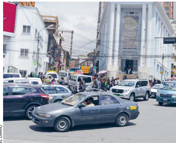
LAS NUEVAS TARIFAS DEL TRANSPORTE PÚBLICO DE LA PAZ ENTRARÁN EN VIGENCIA DESDE EL LUNES 22 DE ESTE MES.

toria de amor inesperada entre dos mujeres de diferentes edades y entornos sociales.