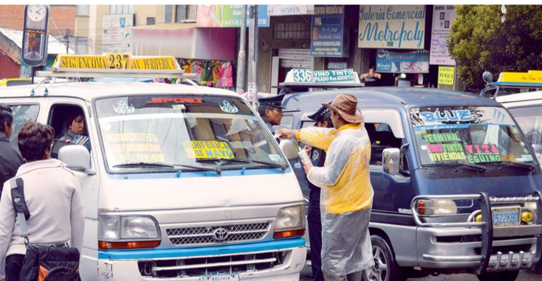
TRAS LA APLICACIÓN DE TARIFAS PARA MINIBUSES Y CARRYS, SE PUDO EVIDENCIAR QUE MUCHOS USUARIOS DESCONOCIAN DE LA PUESTA EN VIGENCIA DE NUEVOS PASAJES.

En el segundo día de la aplicación de la nueva tarifa en la ciudad de La Paz, algunos choferes, principalmente los que descienden desde la ciudad de El Alto, no respetan la disposición municipal e intentan cobrar Bs 2,50 aún en la jurisdicción paceña.