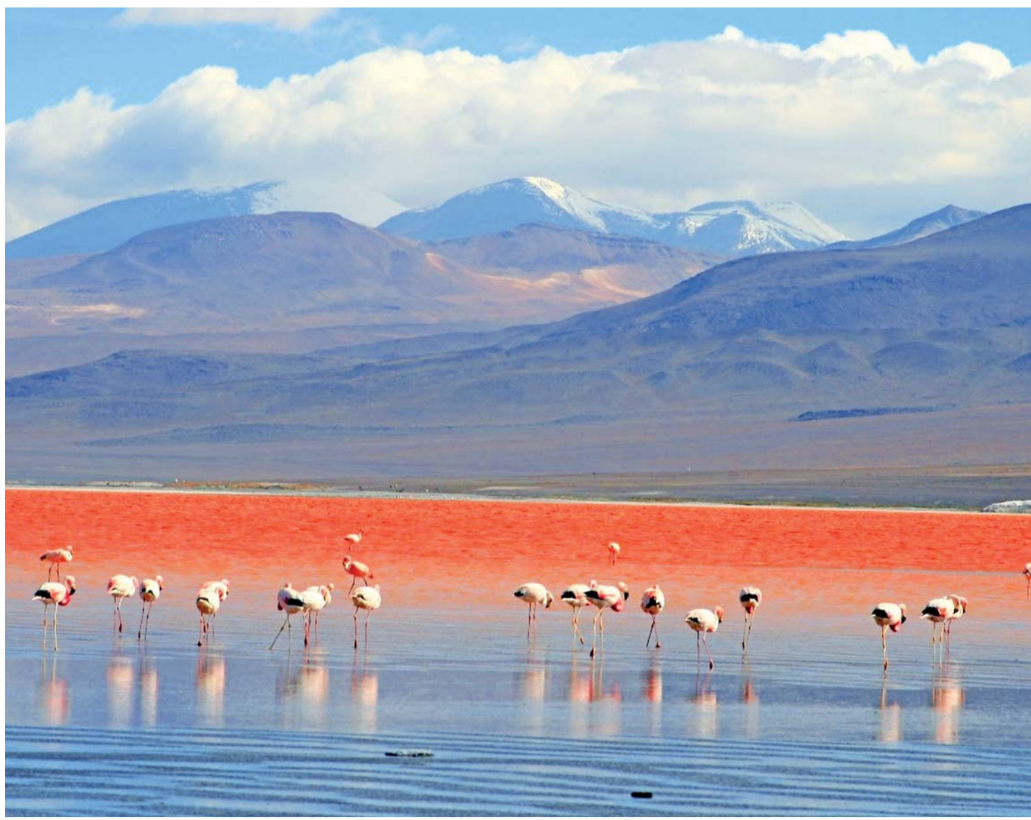
LA LAGUNA COLORADA TIENE 10,7 KM DE LARGO POR 9,6 KM DE ANCHO CON UNA SUPERFICIE DE 54 KM² Y UNA PROFUNDIDAD PROMEDIO DE 35 CM. ESTÁ CONSIDERADA UNA LAGUNA DE TIPO ALTO ANDINA-SALINA, ADEMÁS CONTIENE ISLAS DE BÓRAX EN LOS SECTORES NORESTE Y SUDESTE. CUENTA CON UN PERÍMETRO COSTERO DE 35 KILÓMETROS.

Asimismo, informó que mientras se hacen los estudios de ese fenómeno para encontrar una solución al problema, se pretende trasladar agua desde las comunidades más cercanas a la Laguna, pero dijo que dependerá de un estudio.