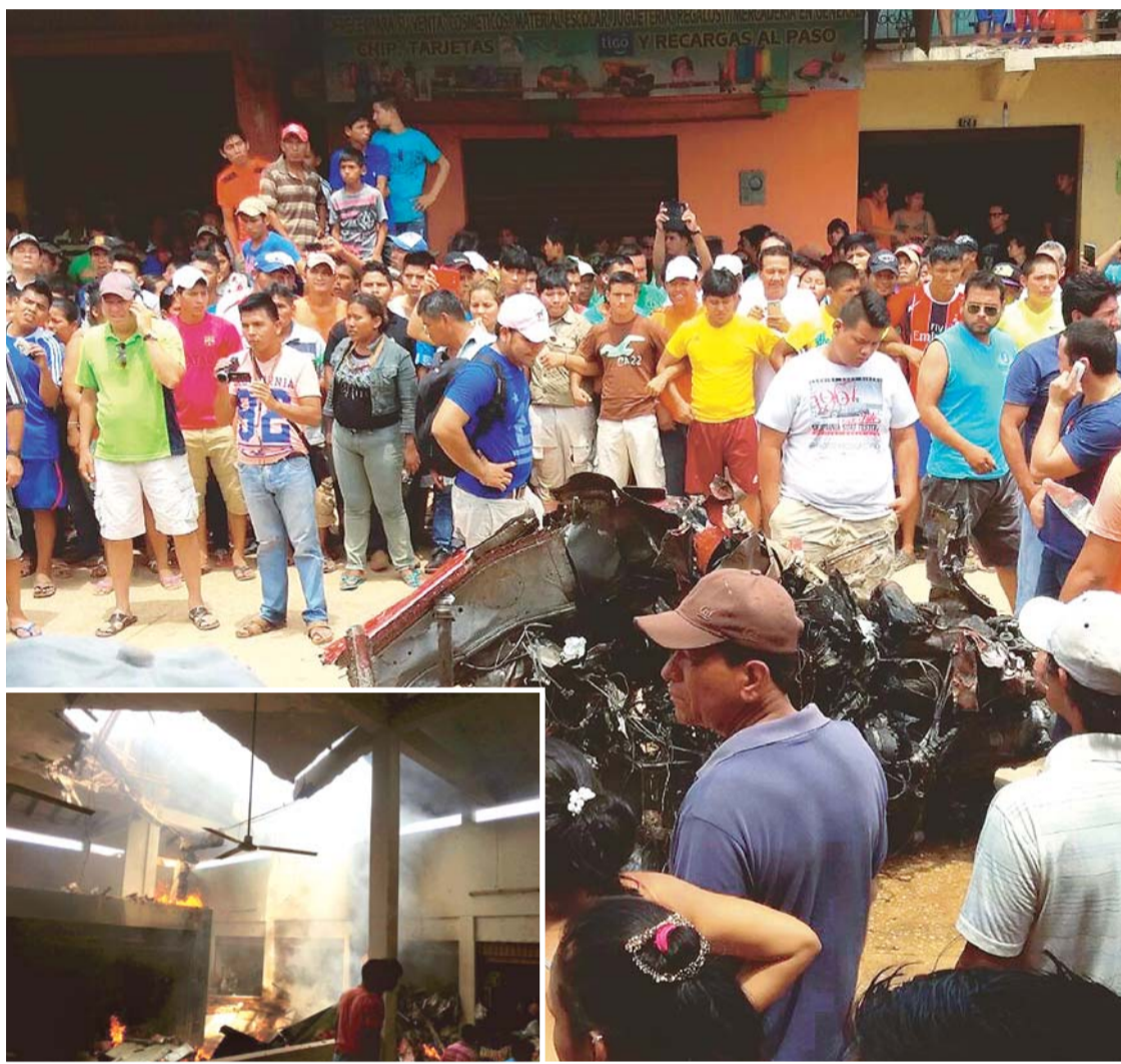
IMÁGENES DE LA TRAGEDIA AÉREA QUE AYER ENLUTÓ A LA POBLACIÓN BENIANA.

Nuevamente el Presidente amenaza a medios de prensa