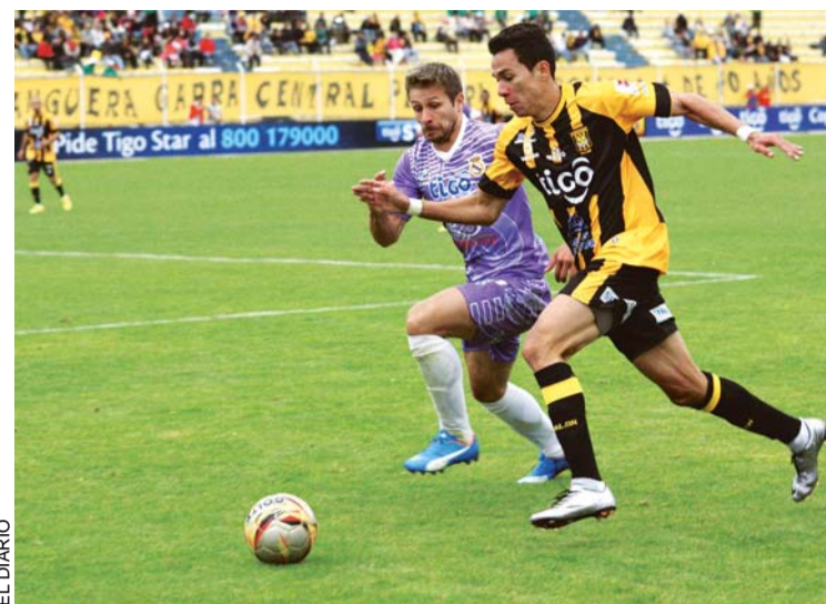
INCIDENCIA DEL PARTIDO DISPUTADO AYER, EN EL ESTADIO HERNANDO SILES.