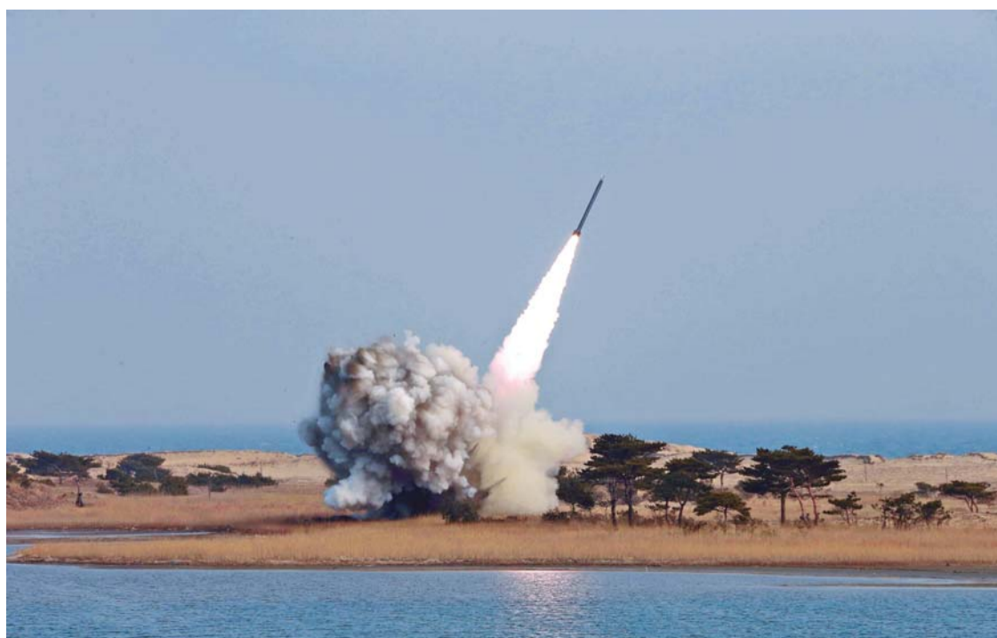
UNA NUEVA DEMOSTRACIÓN NORCOREANA DE FUERZA MILITAR SE REGISTRÓ DESPUÉS DE QUE EEUU, COREA DEL SUR Y JAPÓN REAFIRMARAN EN WASHINGTON SU UNIDAD CONTRA PROGRAMAS NUCLEARES Y MISILES.

sus actividades, excusa que perjudica en la ejecución de muchos proyectos.