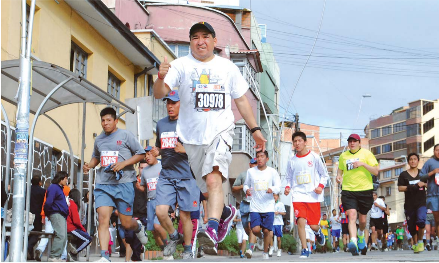
LA TRADICIONAL PRUEBA PEDESTRE POR LOS 112 AÑOS DE EL DIARIO, SE CORRERÁ EL DOMINGO 17 DE ESTE MES A PARTIR DE LAS 7:30 HORAS EN LAS CATEGORÍAS: MENORES, JUVENILES, MAYORES, SENIOR'S "A", SENIOR'S "B" Y DEPORTE INTEGRADO (DAMAS Y VARONES).

Los participantes nacionales y del exterior del país también podrán hacer llegar su solicitud de inscripción al correo electrónico: carrera@eldiario.net , en el sitio web: www.eldiario.net o podrán inscribirse por facebook: eldiario.bolivia .