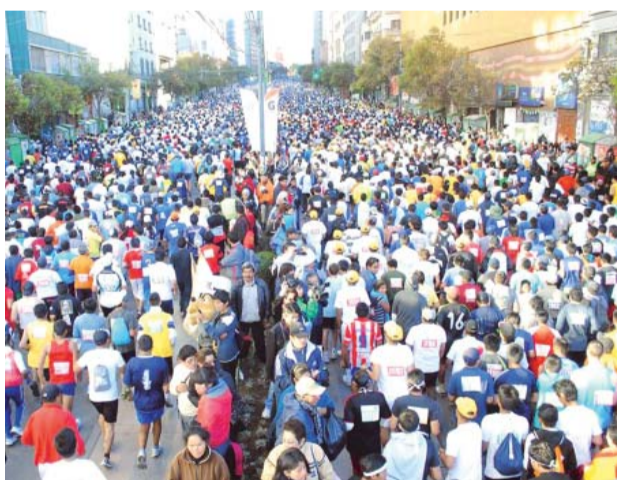
MASIVA PARTICIPACIÓN EN EL ACONTECIMIENTO DEPORTIVO MÁS IMPORTANTE DEL AÑO: LA PRUEBA PEDESTRE DE EL DIARIO.

Las inscripciones están abiertas hasta un día antes de la competencia y son recibidas en la oficina central del "Decano de Prensa Nacional", ubicada en la calle Loayza Nº 118, y en todas las sucursales de diferentes zonas y de las ciudades más importantes del país. También se puede realizar el registro a través del correo electrónico carrera@eldiario.net o en el sitio web www.eldiario.net.