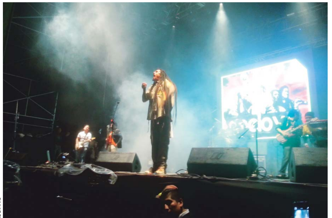
EL REGGAE TRANSMITIÓ MENSAJES DE AMOR, RESPETO Y UNIDAD A LA JUVENTUD PACEÑA CON LA REALIZACIÓN DEL CONCIERTO "ONE LOVE".