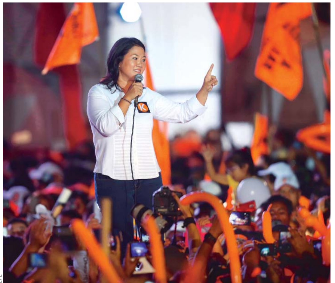
LA CANDIDATA DE FUERZA POPULAR, KEIKO FUJIMORI, ES LA FAVORITA PARA ASUMIR LA PRESIDENCIA PARA EL PERIODO 2016-2021.