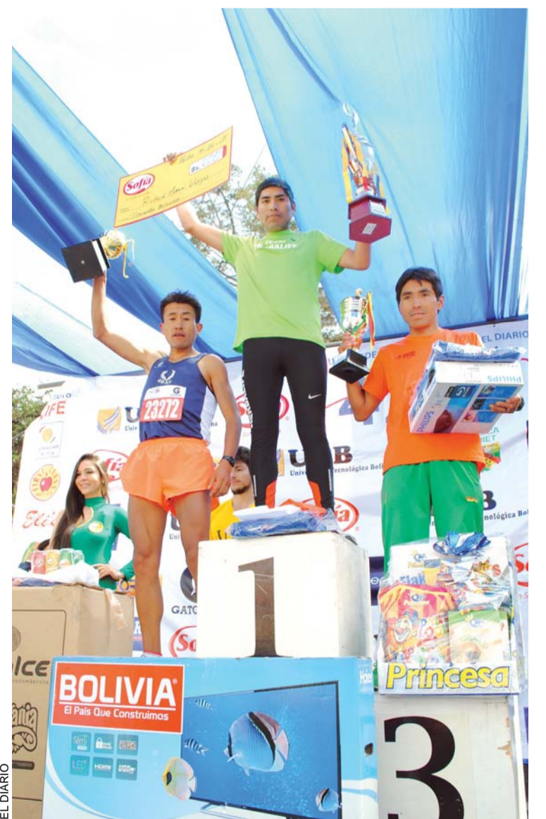
EL DIARIO INCENTIVA LA PRÁCTICA SANA DEL DEPORTE.