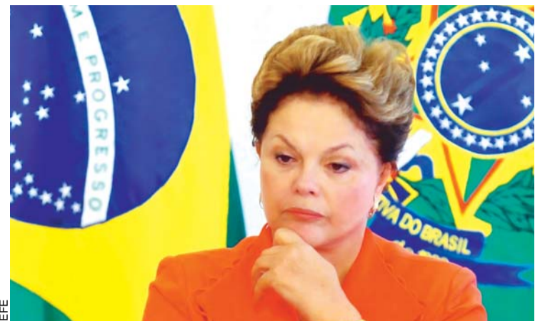
LA PRESIDENTA DEL BRASIL, DILMA ROUSSEFF, EN EL PEOR MOMENTO DE SU MANDATO.