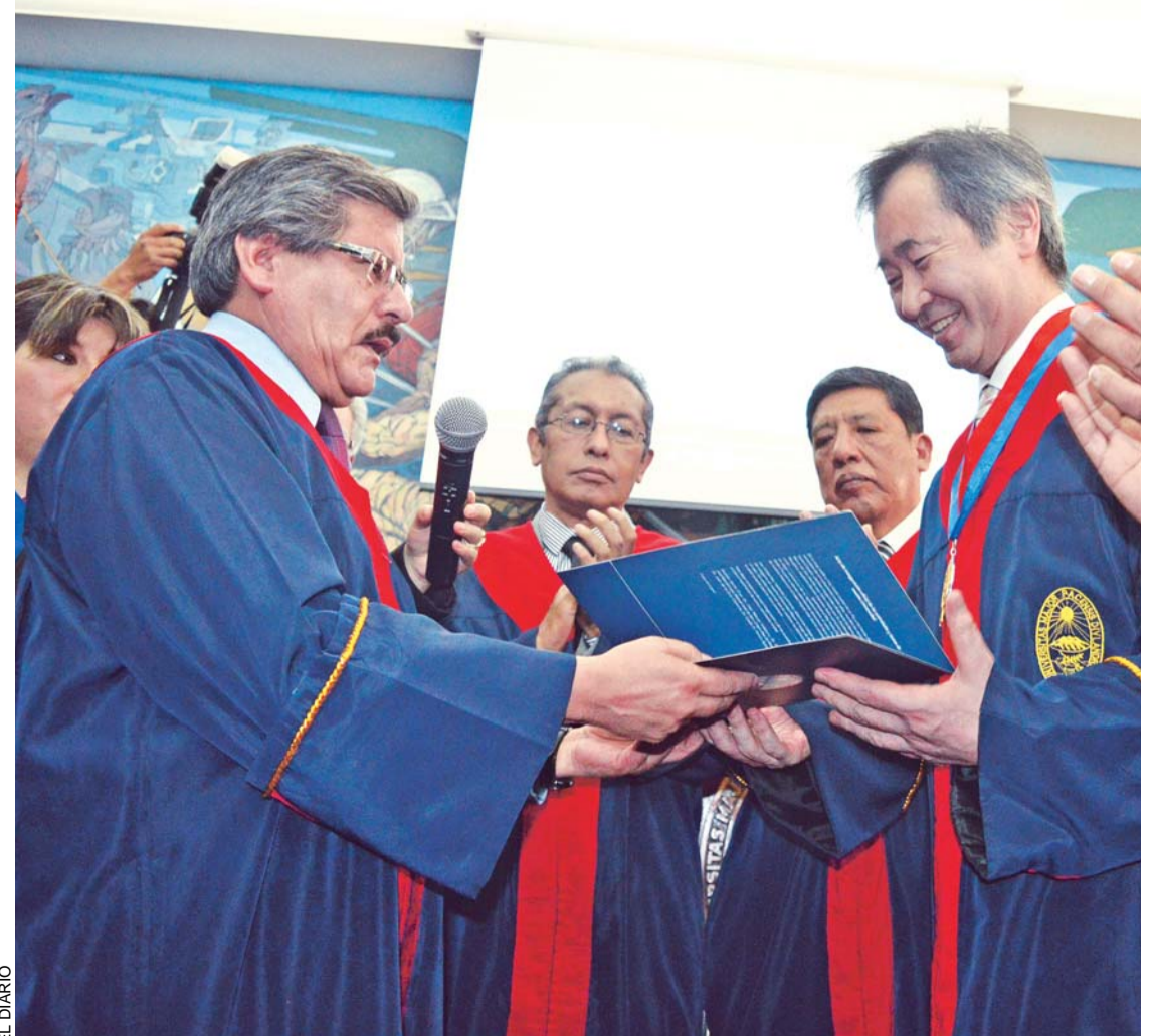
TAKAAKI KAJITA RECIBE EL HOMENAJE DE LOS ACADÉMICOS PACEÑOS.

Hoy en el suplemento "Nuevos Horizontes"