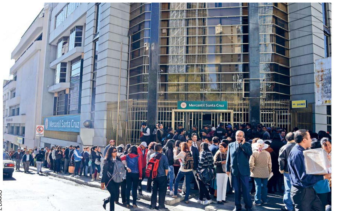
AÚN EXISTE INCERTIDUMBRE EN CLIENTES DE LA EX MUTUAL LA PAZ.