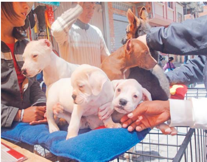
VENTA INDISCRIMINADA DE MASCOTAS

La venta indiscriminada de animales domésticos continúa en las ciudades de La Paz y El Alto sin control alguno. EL DIARIO pudo evidenciar, en un recorrido realizado por esos lugares, que los precios oscilan entre Bs 20 hasta más de 100 dólares.