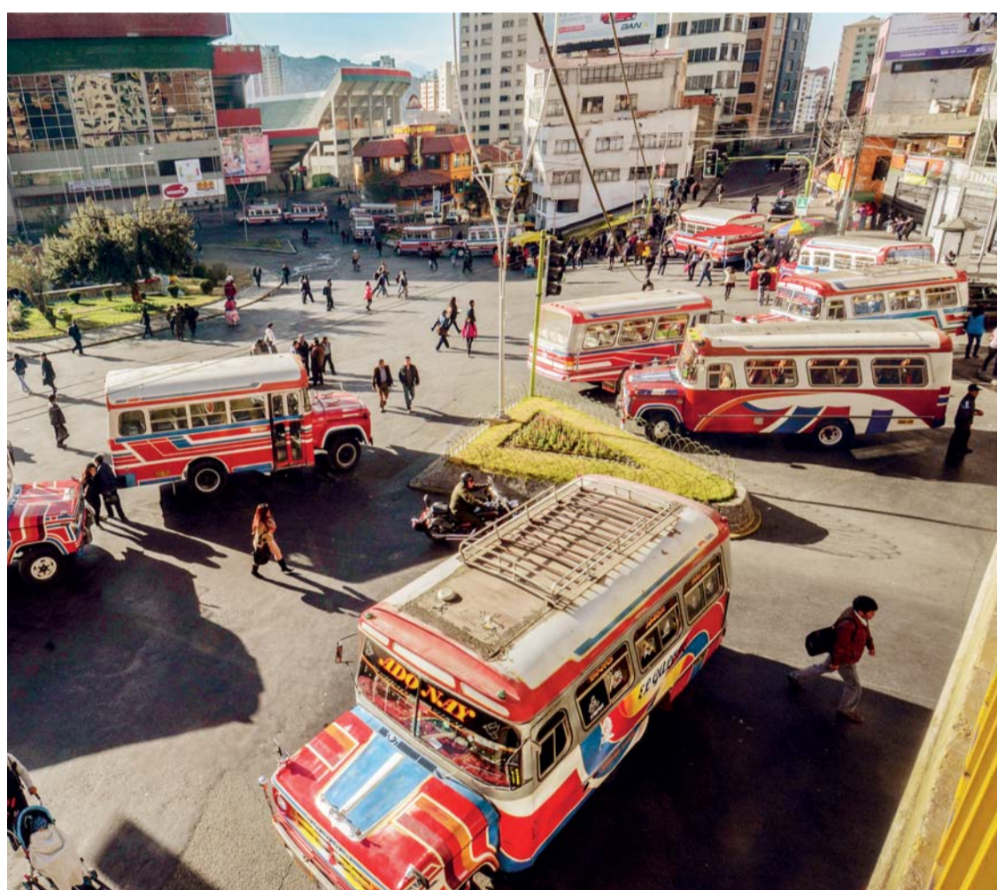
LOS CIUDADANOS QUE SE VIERON OBLIGADOS A CAMINAR VARIOS KILÓMETROS PARA LLEGAR A SUS FUENTES LABORALES EXPRESARON SU REPUDIO A LA MEDIDA, ADEMÁS CRITICARON LA PASIVIDAD DE LOS EFECTIVOS POLICIALES ANTE LA AGRESIVIDAD DEMOSTRADA POR LOS CHOFERES.

El paro del transporte público ocasionó, nuevamente, una serie de perjuicios a la ciudadanía paceña que repudió esta medida, calificándola de "descarada", ya que debido al bloqueo en 35 puntos de acceso a la ciudad de La Paz, originó también las suspensiones de viajes interdepartamentales desde la Terminal de Buses y las labores escolares en unidades educativas fiscales y privadas.