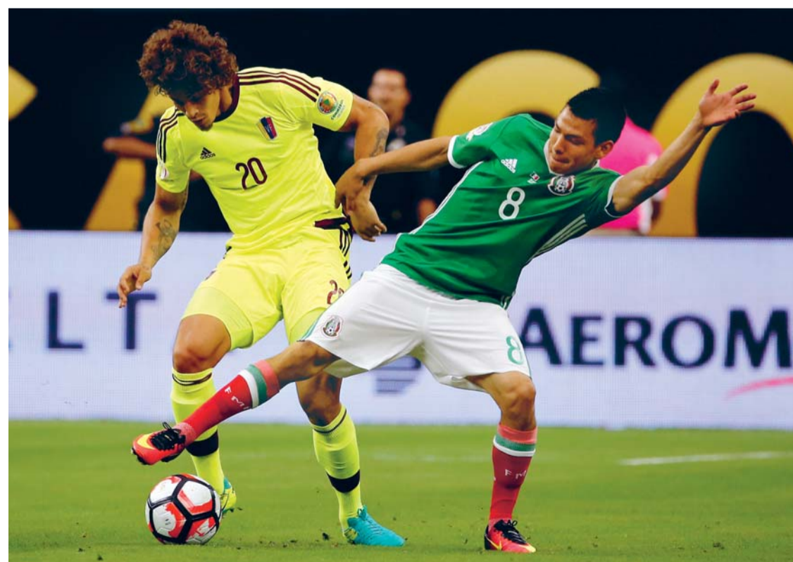
México terminó primero en Grupo C

EN UN ATRACTIVO PARTIDO, MÉXICO IGUALÓ 1-1 CON VENEZUELA Y SE QUEDÓ CON EL PRIMER LUGAR DEL GRUPO "C" DE LA COPA AMÉRICA CENTENARIO. AUNQUE LOS DOS EQUIPOS TERMINARON CON LA MISMA CANTIDAD DE PUNTOS (7), "EL TRI" TUVO MEJOR DIFERENCIA DE GOL Y ESO LE PERMITIÓ FINALIZAR COMO LÍDER DE LA ZONA DE LA CUAL SALDRÁ EL RIVAL DE LA ARGENTINA EN CUARTOS DE FINAL.