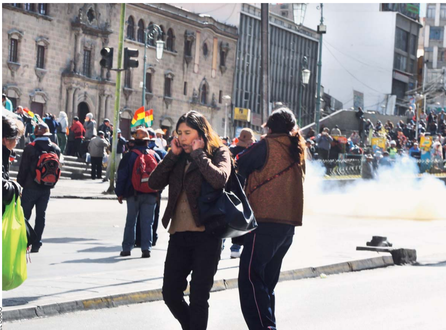
EL PARO DE 24 HORAS CONVOCADO POR LA CENTRAL OBRERA BOLIVIANA FUE ACATADO PARCIALMENTE EN EL PAÍS. LA MOVILIZACIÓN PARALIZÓ LAS ACTIVIDADES COTIDIANAS EN LA URBE PACEÑA.

De acuerdo con la OMS, la enfermedad, transmitida por el mosquito del género Aedes aegypti, puede ocasionar trastornos neurológicos y malformaciones congénitas en recién nacidos. (prensa-latina.cu)