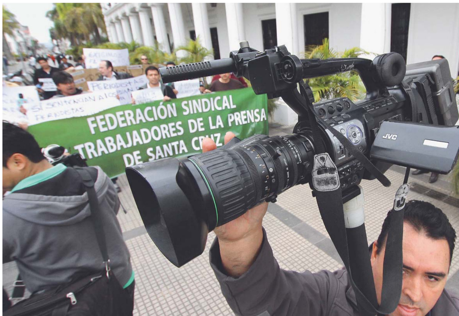
"LA LEY DE IMPRENTA ESTÁ VIGENTE" ERAN LOS CÁNTICOS DE DECENAS DE PERIODISTAS EXPRESADOS EN UNA MARCHA DESDE LA PLAZA 24 DE SEPTIEMBRE AL PALACIO DE JUSTICIA, EN RECHAZO A LOS PROCESOS JUDICIALES QUE SE REALIZAN POR MEDIO DE LA VÍA ORDINARIA CONTRA VARIOS PERIODISTAS DEL PAÍS.