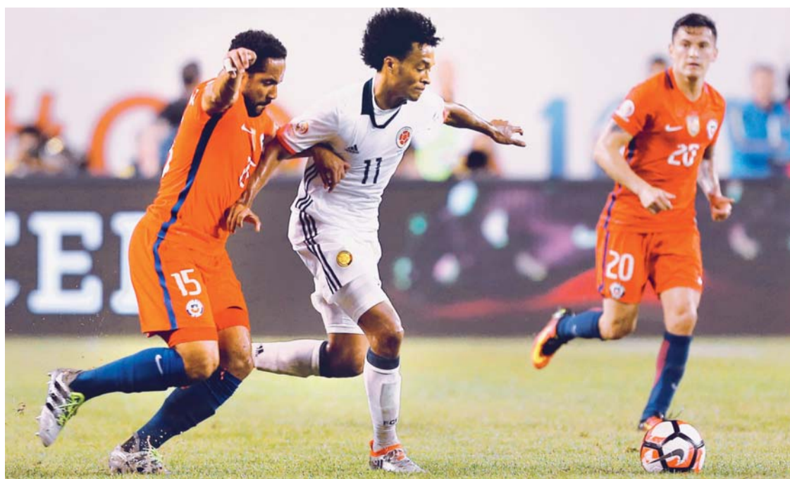
Chile acabó con sueño de Colombia

LA SELECCIÓN CHILENA ACABÓ HOY CON EL SUEÑO DE COLOMBIA DE LLEGAR A SU SEGUNDA FINAL DE COPA AMÉRICA CENTENARIO, TRAS QUINCE AÑOS DE HABERSE CORONADO CAMPEONA DEL TORNEO, AL VENCERLE POR 0-2 EN LA SEMIFINAL DISPUTADA EN CHICAGO. LOS COLOMBIANOS PERDIERON ANTE LOS CHILENOS EN EL ESTADIO SOLDIER FIELD, LO QUE LES LLEVA AL PARTIDO POR EL TERCER PUESTO