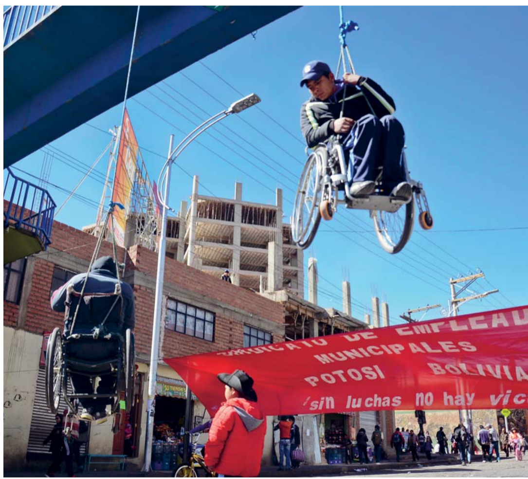
PERSONAS CON DISCAPACIDAD PERMANECIERON COLGADAS EN EL PUENTE DE LA PASARELA DE LA CIUDAD DE POTOSÍ, DONDE TAMBIÉN LOS TRABAJADORES ACATAN EL PARO DE LA COB.

• Personas con discapacidad mantienen huelga de hambre en el país