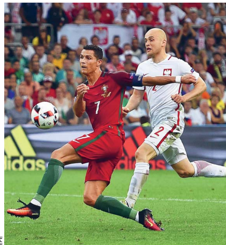
CRISTIANO RONALDO FUE PIEZA IMPORTANTE PARA LA VICTORIA DE PORTUGAL ANTE POLONIA EN EL ESTADIO VELÓDROMO DE MARSELLA.

El encuentro reglamentario concluyó empatado. Posteriormente, Portugal ganó 5-3 a Polonia por penales.